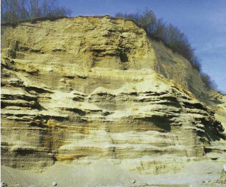
Rißzeitliche Kiese und Sande: Kiesgrube Scholterhaus/Biberach-Warthausen

Die Fluvioglazialen Kiese und Sande wurden abgelagert