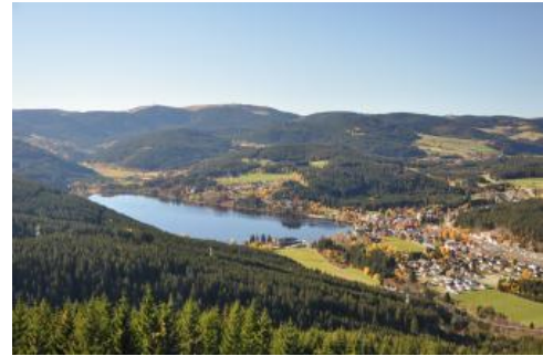
Blick über den Titisee zum Feldberg

Durch das Einschneiden der Flüsse v. a. im Eiszeitalter, das vor rund 2,6 Millionen Jahren begann, nahm das Relief des Schwarzwalds immer mehr seine heutige Form an. In den kältesten Phasen erfolgte zudem eine Formung durch das Gletschereis. Während der Südschwarzwald in der letzten Eiszeit von einer großen Eiskappe bedeckt war, gab es im Nordschwarzwald viele kleinere Kargletscher. Das Großrelief des Schwarzwalds ist durch den Unterschied zwischen dem intensiv zertalten Steilabfall zum Rheingraben im Westen und der sanft geneigten Abdachung auf der Ostseite geprägt. Die Flüsse waren dort in der späten Tertiärzeit alle noch Teil des Flusssystemes der Donau. Heute sind es noch deren Quellflüsse Brigach und Breg, die von Osten weit in den Schwarzwald eingreifen. In den Wasserscheidenbereichen finden sich sanfte Landschaftsformen mit Hochflächencharakter.