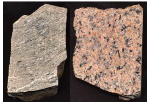
Handstücke eines Gneisanatexit (links) und eines grobkörnigen Bärhalde-Granits aus dem Südschwarzwald