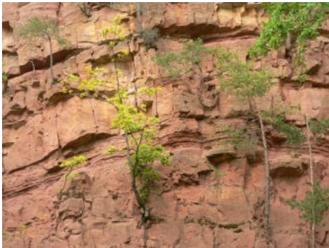
Aufgelassener Steinbruch im Mittleren Buntsandstein bei Baden-Baden

Im darauffolgenden Erdmittelalter war Südwestdeutschland Teil eines großen Beckens, in dem über 100 Millionen Jahre lang die Sedimentgesteine des Deckgebirges abgelagert wurden (Trias und Jura). Die Gesteine des Buntsandsteins sind besonders im Nordschwarzwald noch weiträumig erhalten, sie bilden die unterste Stufe der südwestdeutschen Schichtstufenlandschaft. Die überwiegend sandigen Sedimente wurden vor rund 250 Millionen Jahren von Flüssen mit sehr unregelmäßiger Wasserführung in wüstenartigem Klima abgelagert. Die auffallend rote Farbe der Gesteine ist auf Eisenoxid-Überzüge auf den Quarzkörnern zurückzuführen.