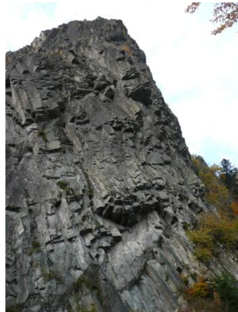
Deckenporphyr, Scharfenstein (Münstertal/Schwarzwald)

Im Kristallin des Schwarzwalds kommen in Trögen paläozoische Sedimente (z. B. die Rotliegend-Tröge bei Baden-Baden) und in tektonischen Grabenstrukturen gefaltetes Paläozoikum (z. B. die Badenweiler–Lenzkirch-Zone) vor. Die paläozoischen Gesteine sind überwiegend Grundwasseringeleiter. Eine Ausnahme bilden die Rotliegend-Magmatite. Sie sind als meist gering ergiebige Kluftgrundwasserleiter ausgebildet. Im Südschwarzwald treten aus dem engständig geklüfteten Münstertal-Quarzporphyr Quellen aus, die zur Trinkwasserversorgung genutzt werden.