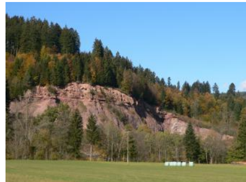
Steinbruch im Murgtal bei Baiersbrunn-Klosterreichenbach mit aufgeschlossener Grenze zwischen Deckgebirge und Grundgebirge

Die gefleckten Sandsteine der Tigersandstein-Formation an der Basis wurden früher dem Unteren Buntsandstein zugerechnet, sind aber gleich alt wie der Zechstein Norddeutschlands und werden heute als randliche Ablagerung mit diesem zusammengefasst. Darüber folgen im Unteren und Mittleren Buntsandstein dickbankige, partiell Quarzkies führende Sandsteine. Die Sandsteinbänke sind teils tonig gebunden und leicht verwitterbar. Teils sind sie verkieselt und hart. Der Obere Buntsandstein besteht aus überwiegend plattigen Sandsteinen und Tonsteinen.