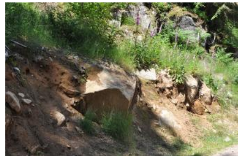
Bodenaufschluss im Triberger Granit

Durch Verwitterung, Verlehmung und Verbraunung sind aus den silikatischen Gesteinen mehr oder weniger steinige, lehmig-sandige Böden hervorgegangen, die als Braunerden bezeichnet werden. Sie haben sich nur stellenweise aus anstehendem Felsgestein entwickelt. Meist ist die Bodenentwicklung in oft mehrschichtigen Schuttdecken abgelaufen. Diese sind durch Frostverwitterung und verschiedene Verlagerungsprozesse in der letzten Kaltzeit entstanden. Die Eigenschaften und Entwicklungstiefe der Böden korrespondieren eng mit der Mächtigkeit der Schuttdecken. Diese ist auf Bergkuppen, an Oberhängen und auf Hangrippen meist gering, kann aber an Unterhängen viele Meter betragen.