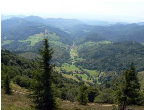
Blick vom Belchen ins Kleine Wiesental im Südschwarzwald

Deutschlands höchstes Mittelgebirge lässt sich geographisch in einen nördlichen, mittleren und südlichen Abschnitt gliedern. Geologisch kann man das Gebiet grob in den Grundgebirgs-Schwarzwald und den Buntsandstein-Schwarzwald unterteilen. Man spricht von Grundgebirge, weil auf diesem Fundament die viel jüngeren Gesteine des sog. Deckgebirges abgelagert wurden. Die Sedimentgesteine des jüngeren Perms und des Buntsandsteins überlagern die Kristallingesteine des Grundgebirges v. a. im Nordschwarzwald und am Ostrand des Mittleren Schwarzwalds. Sie treten aber auch im Westen und Südwesten, im Bereich der Buntsandsteinberge bei Lahr und Emmendingen sowie im Weitenauer Bergland in Erscheinung und bilden am Ost- und Südrand des Südschwarzwalds kleine Vorkommen (Günther, 2010).