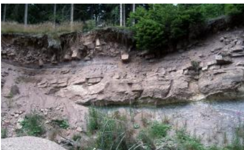
Buntsandstein über Granitzersatz (Steinbruch bei Grafenhausen-Balzhausen)

An der Ostabdachung des Schwarzwalds bilden die mächtigen Sandsteinfolgen des Buntsandsteins Kluftgrundwasserleiter. In den konglomeratischen Lagen und in der Auflockerungszone können die Grundwasserfließgeschwindigkeiten z. T. sehr hoch sein. Im Mittleren Buntsandstein führen die grobkörnigen Schichtglieder das meiste Grundwasser. Sie bilden den Hauptgrundwasserleiter. Der Obere Buntsandstein ist durch eine Wechselfolge von Grundwasseringeleitern und Kluftgrundwasserleitern charakterisiert. Oberflächennah gibt es zahlreiche Kluft- und Hangschuttquellen mit begrenzten Einzugsgebieten, an der Grenze zum Grundgebirge treten an Quellenlinien zahlreiche ergiebige Quellen aus.