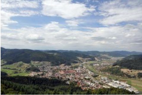
Blick über Haslach nach Nordwesten durchs Kinzigtal

Das Klima des Schwarzwalds, der in seiner Längserstreckung quer zu den vorherrschenden, niederschlagbringenden Westwinden liegt, ist deutlich ozeanisch geprägt. Die Niederschlagsmengen sind hoch und die Winter relativ mild. Charakteristisch ist ein starker Gradient mit rasch ansteigenden Jahresmittelwerten von 1100 mm Niederschlag am westlichen Fuß des Schwarzwalds auf bis zu 2100 mm in den höchsten Lagen. Die im Südwesten, jenseits des Rheingrabens gelegenen Hochvogesen fangen bereits einen Teil der Niederschläge ab, so dass die Niederschlagsmengen im Südschwarzwald nicht über denen des weniger hohen Nordschwarzwalds liegen. Am relativ niedrig gelegenen Westrand des Mittleren Schwarzwalds betragen die durchschnittlichen Jahresniederschläge verbreitet nur 1000–1100 mm. In Leelage erfolgt