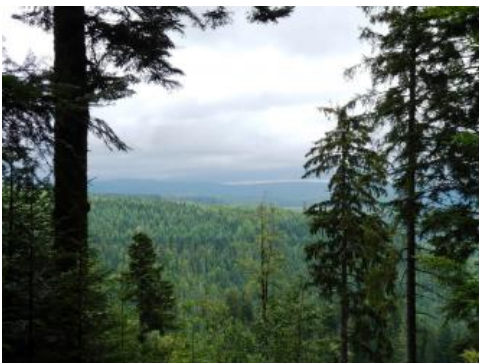
Zertalter Grindenschwarzwald zwischen oberem Murgtal und Schwarzwaldhochstraße westlich von Baiersbrunn

Kühlfeuchtes Klima, nährstoffarme, saure Sandböden und steile Hänge sind der Grund für die überwiegende forstliche Nutzung des Schwarzwalds. Den höchsten Wald- und Nadelholzanteil findet man auf den sauren, nährstoffarmen Böden des Buntsandstein-Schwarzwalds. Der Grundgebirgs-Schwarzwald ist dagegen in weiten Bereichen eine offener und abwechslungsreichere Landschaft, mit einem hohen Anteil an Wiesen und Weiden. In vielen Bereichen, v. a. am klimatisch begünstigten westlichen Anstieg, finden sich Laub- und Mischwälder, denen sich in den tieferen Lagen, im Übergang zur Vorbergzone, Obstwiesen und Weinberge anschließen (Wilmanns, 2001).