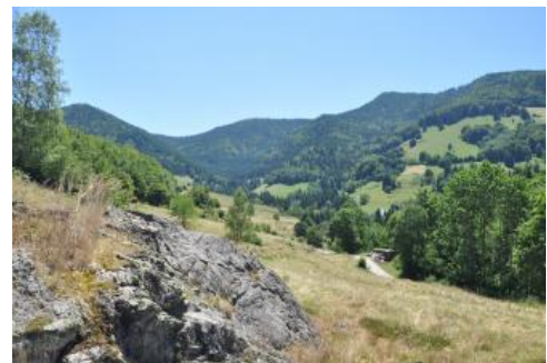
Südschwarzwald bei Todtnau-Präg

Der überwiegend von Gesteinen des Grundgebirges aufgebaute Südschwarzwald ist der höchste, am stärksten herausgehobene Teil des Schwarzwalds. Die höchsten Berge (Feldberg 1493 m NN, Herzogshorn 1415 m NN, Belchen 1414 m NN) haben mit ihren unbewaldeten, weithin sichtbaren, oft noch im Mai mit Schnee bedeckten Gipfelregionen bereits subalpinen Charakter (Regierungspräsidium Freiburg, 2012a). Das Fehlen von Gehölzen ist allerdings eine Folge der jahrhundertelangen Nutzung der Bergkuppen als sommerliche Hochweiden. Im Westen dieser zentralen Erhebungen führte die Höhendifferenz von über 1000 m zur benachbarten Oberrheinebene zu einem lebhaften Relief mit tief eingeschnittenen, gefällereichen Tälern. Blickt man hingegen vom Feldberg nach Osten, so hat man eine sanft abfallende Hochfläche mit breiteren Tälern vor sich, die von der sog. Urdonau und ihren Nebentälern geschaffen wurden und heute zum Wutacheinzugsgebiet gehören. Auch auf der Südabdachung des Schwarzwalds, im Hotzenwald, finden sich von engen Tälern zerschnittene Hochflächen, die staffelartig zum Hochohrhental hin abfallen. Landschaftsprägend waren für den zentralen Südschwarzwald die Vergletscherungen der letzten Kaltzeiten. Sie haben Seen wie den Titisee, Gletscherablagerungen und breite Trogtäler hinterlassen.