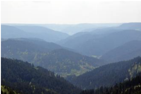
Das Schiltachtal im Mittleren Schwarzwald zwischen Schiltach und Schramberg

Beim Mittleren Schwarzwald handelt es sich um die gegenüber dem Nord- und Südschwarzwald insgesamt niedriger gelegene, v. a. von den Flusssystemen der Kinzig und Elz stark zertalte Berglandschaft (Mäckel, 2014), die im Süden etwa bis zur Linie Freiburg–Titisee-Neustadt (Dreisamtal–Gutachtal) reicht. Vorherrschende Gesteine im Mittleren Schwarzwald sind Gneise. Ein großes Granitgebiet findet sich im Osten, im Raum Triberg/Schramberg. Die Bergkuppen des Kinzigeinzugsgebiets befinden sich überwiegend in Höhenlagen zwischen 450 und 800 m NN. Ihnen sind einzelne höhere Bergplateaus aus Buntsandstein aufgesetzt (z. B. Mooskopf, 871 m NN). Südlich des Elztals treten höhere Erhebungen auf, die von ihrem Landschaftscharakter bereits mit dem Südschwarzwald vergleichbar sind (z. B. Kandel 1241 m NN). Im Osten bildet ein schmaler Streifen