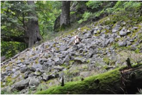
Schutthalde aus Flasergneisgestein (Kybfelsen bei Freiburg im Breisgau)

Die magmatischen Granite und metamorphen Gneise des Kristallinen Grundgebirges führen im unverwitterten Zustand nur wenig Grundwasser, das auf einzelnen Klüften und Spalten fließt. Mit der Tiefe nehmen die Kluftweite und der Kluftabstand rasch ab. Folglich ist das Kristallin ein Grundwasseringeleiter, bereichsweise ein gering ergiebiger Kluftgrundwasserleiter. Im oberflächennahen Verwitterungs- und Auflockerungsbereich, in grobporigen Hangschuttdecken und auf Störungszonen fließt mehr Grundwasser. Dort entspringen zahlreiche Quellen, die aufgrund ihrer kleinen Einzugsgebiete jedoch vielfach durch starke Schüttungsschwankungen gekennzeichnet sind.