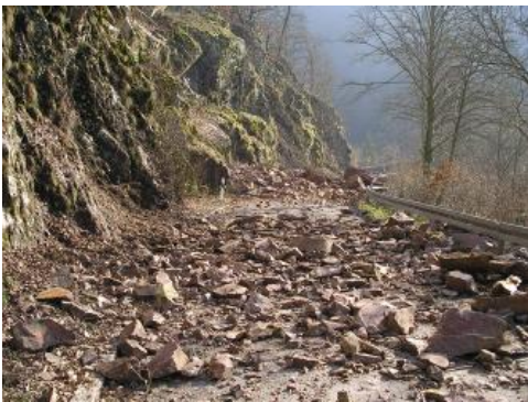
Felssturz an der Kreisstraße K6561 bei Berau

Bedingt durch das relativ steile Mittelgebirgsrelief sind gravitative Massenbewegungen die häufigsten geogenen Naturgefahren im Schwarzwald. An felsigen Steilhängen der Täler im kristallinen Grundgebirge sowie im Ausstrichbereich des Buntsandsteins ist häufig mit Sturzereignissen zu rechnen. Zeugen vergangener Ereignisse sind zahlreiche Blockfelder und Felsenmeere, die im gesamten Gebiet des Schwarzwalds zu finden sind.