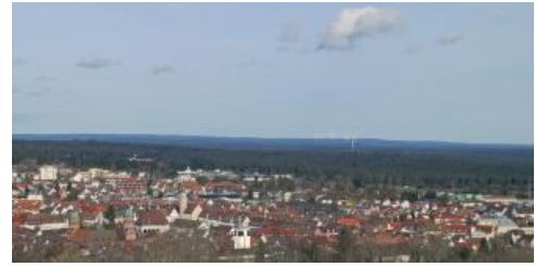
Blick von der Friedrichshöhe bei Freudenstadt über das Stadtgebiet und die bewaldeten Schwarzwald-Randplatten nach Norden, zum Windpark Nordschwarzwald

Östlich davon wird das Landschaftsbild v. a. durch den Buntsandstein geprägt. Die Sandsteinschichten bilden ein schwach nach Südosten geneigtes Flachrelief, das durch tief eingeschnittene Täler zerschnitten ist (Murg-, Alb-, Enz- und Nagoldtal). Im zentralen Bereich des Nordschwarzwalds bilden sie den Naturraum „Grindenschwarzwald und Enzhöhen“, eine kaum besiedelte, überwiegend von dunklen Nadelwäldern bestandene Hochflächenlandschaft. Als Grinden (schwäb. „Grind“ = Kopf) werden die höchsten, waldfreien Hochflächen bezeichnet (z. B. Hornisgrinde 1163 m NN). Auf den im Osten und Norden anschließenden, weniger hoch gelegenen „Schwarzwald-Randplatten“ werden die Waldgebiete immer wieder von Rodungsinseln und Siedlungen unterbrochen. Klima und Böden sind hier weniger extrem als im Grindenschwarzwald und lassen in gewissem Umfang eine landwirtschaftliche Nutzung zu.