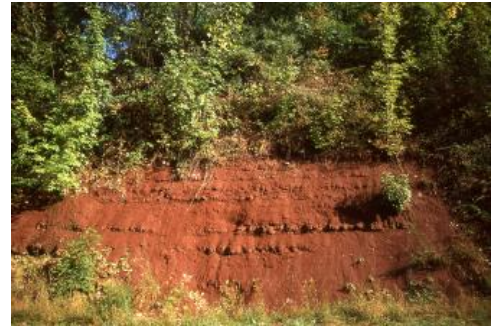
Rotliegend-Sedimente bei Gaggenau

Im Karbon war das Gebiet des heutigen Schwarzwalds Teil eines Hochgebirges, das sich von Spanien bis Tschechien quer durch Europa erstreckte. Der Abtragungsschutt dieses Gebirges zeigt sich im Schwarzwald noch in unreifen, an Feldspat reichen Sedimenten aus dem späten Karbon und Perm. Während die Ablagerungen des Oberkarbons noch in einem tropischen Gebirgsklima entstanden und geringe Mengen Kohle enthalten, geriet der süddeutsche Raum im Perm in den subtropischen Wüstengürtel. Rote Schuttablagerungen, Sandsteine und Feinsedimente aus dem frühen Perm sammelten sich als Rotliegend-Sedimente in mehreren tektonisch entstandenen Becken, an deren Rändern rhyolithische Magmen aufstiegen und es zu Vulkanausbrüchen kam. Quarzporphyre und Tuffe zeugen noch als Rotliegend-Magmatite von diesen Ereignissen (Geyer et al., 2011).