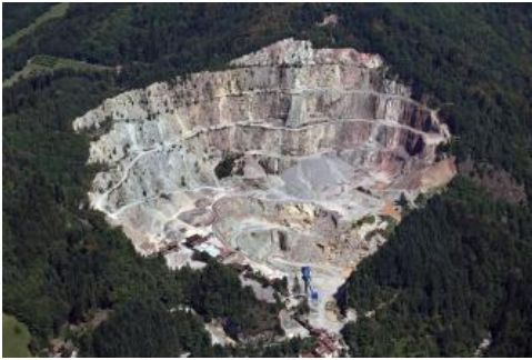
Luftbild des Steinbruchs Ottenhöfen

Erwähnenswerter Abbau auf geringmächtige Kohleflöze ging zwischen 1755 und 1926 im schmalen Oberkarbonvorkommen zwischen Diersburg und Berghaupten um. Unter schwierigen Bedingungen wurden dort insgesamt ca. 500.000 t hochwertige Anthrazit-Kohle gefördert.