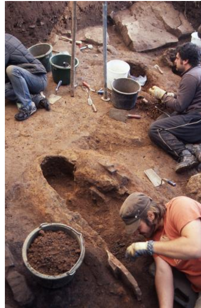
Archäologische Ausgrabung von keltischen Rennöfen

Auf vielen, bereits durch den Erzbergbau bekannten Gängen begann ab Mitte des 19. Jh. der Bergbau auf Schwerspat ( \text{BaSO}_4 ). Der reinweiße Baryt wurde zunächst für die Herstellung lichtechter Farben benötigt und wird heute vielfältig eingesetzt (z. B. als Zusatz zur Bohrspülung bei Tiefbohrungen, Fotopapier, Schwerbeton, Kontrastmittel bei Röntgenuntersuchungen). Mit zunehmender Industrialisierung wurde im 20. Jh. dann auch der oft auf gleicher Lagerstätte vorkommende Flusspat ( \text{CaF}_2 ) bergmännisch gewonnen; aus ihm werden z. B. Hüttenspat (Flussmittel für den Hochofenprozess), Kryolith (zur Aluminiumherstellung) und Säurespat hergestellt. Hervorzuheben sind zwei Gruben: In der Fluss- und Schwerspatgrube Käfersteige (1935–1997) im Würmtal bei Pforzheim wurde ein bis zu 30 m mächtiger, mindestens bis 500 m unter Tage bauwürdiger Flusspat-Gang aufgefahren. Er gehört zu den größten Ganglagerstätten Europas und birgt noch erhebliche Vorräte.