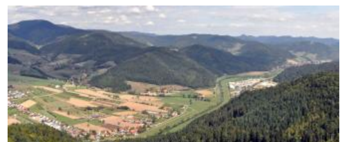
Mittlerer Schwarzwald und Kinzigtal zwischen Haslach und Hausach

Die früher autark wirtschaftenden Schwarzwaldhöfe besaßen Flurstücke in Hanglage, an denen Ackerland im mehrjährigen Rhythmus mit Grünland, Brache oder Niederwald abwechselte. Heute findet sich ackerbauliche Nutzung fast nur noch in wenigen begünstigten Flachlagen des Hotzenwalds, in den tiefsten Lagen auf Terrassenflächen der breiteren Täler sowie auf den Schwarzwald-Randplatten, im Übergang zu den Gäulandschaften.