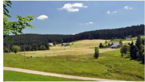
Vermoorte breite Talmulde bei Schönwald-Weißenbach

Charakteristisch für die reliefarmen, niederschlagsreichen Buntsandstein-Hochflächen ist das Vorkommen von Mooren und Böden mit lang anhaltender Staunässe (Stagnogleye). Als Wasserstauer wirken Bodenhorizonte aus tonreichen, dichtgelagerten Fließerden, verfestigte Anreicherungsprofile in Podsolen oder schwer wasserdurchlässige, verkieselte Konglomeratbänke. Auch in den Karen sowie in den Talmulden im Wasserscheidengebiet des Mittleren Schwarzwalds oder im Glazialgebiet des Südschwarzwalds treten verbreitet vernässte und vermoorte Bereiche auf.