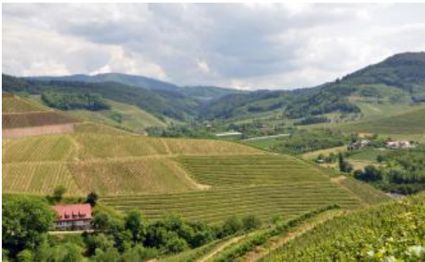
Weinbaulich genutzte Grundgebirgshänge bei Durbach, am Westrand des Schwarzwalds – links hinten ist der Mooskopf zu sehen (Buntsandstein)

Kühlfeuchtes Klima, nährstoffarme, saure Sandböden und steile Hänge sind der Grund für die überwiegende forstliche Nutzung des Schwarzwalds. Den höchsten Wald- und Nadelholzanteil findet man auf den sauren, nährstoffarmen Böden des Buntsandstein-Schwarzwalds. Der Grundgebirgs-Schwarzwald ist dagegen in weiten Bereichen eine offener und abwechslungsreichere Landschaft, mit einem hohen Anteil an Wiesen und Weiden. In vielen Bereichen, v. a. am klimatisch begünstigten westlichen Anstieg, finden sich Laub- und Mischwälder, denen sich in den tieferen Lagen, im Übergang zur Vorbergzone, Obstwiesen und Weinberge anschließen (Wilmanns, 2001).