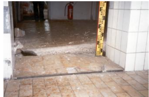
Deformationen eines Hallenbodens durch Hebung

Nach künstlich (z. B. nach Überbauung) bzw. natürlich hervorgerufener Austrocknung von Ölschiefergesteinen der Posidonienschiefer-Formation und untergeordnet der Arienkalk-Formation (beide Unterjura) können durch Gipskristallisation aus sulfathaltigem Grundwasser Hebungen bis zu mehreren Dezimetern auftreten (Wagenplast, 2005).