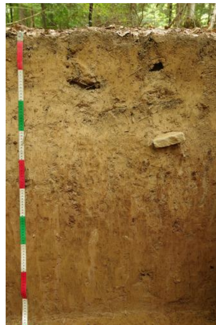
Parabraunerde aus sehr schwach steinigem, periglazial umgelagertem Lösslehm

Die Bodenverbreitung im Albvorland weist eine deutliche Zweigliederung auf. Einerseits herrschen auf den häufig und überwiegend großflächig mit Lösslehm, Lösslehm-Fließerden und bereichsweise mit Löss bedeckten Stufenflächen des Unterjuras Parabraunerden vor, die verbreitet schwach durch Staunässe überprägt sind.