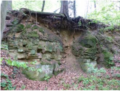
Aufgelassener Mitteljura-Steinbruch (Unterer Donzdorf-Sandstein) am Egenfirst südöstlich von Weilheim an der Teck

In der etwa 150–300 m mächtigen Schichtenfolge des Mitteljuras dominieren dunkelgraue bis schwarze Tonsteine, die untergeordnet durch Mergeltonsteine und Mergelsteine ergänzt werden. An härteren Gesteinsbänken, die zu einer regional stärkeren Gliederung des Reliefs führten, sind v. a. die Bänke der Eisensandstein-Formation zu nennen, die im Vorland der Ostalb als Rücken und Kuppen herauspräpariert wurden sowie die mehrere Meter mächtigen Kalksandsteinbänke des Blaukalks im Bereich des mittleren Albvorlands.