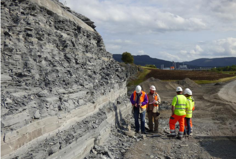
Posidonienschiefer bei Dormettingen

Diese Gesteine werden nicht mehr als Ziegeleirohstoffe, sondern als Zuschlagstoffe für die Zementherstellung gewonnen. In den meisten Tongruben ruht der Abbau jedoch zurzeit. Die bituminösen Ton- und Kalksteine der Posidonienschiefer-Formation finden ebenfalls als Zuschlagstoff bei der Zementproduktion Verwendung. Darüber hinaus werden sie für balneotherapeutische Zwecke genutzt, aus bestimmten Horizonten werden außerdem Naturwerksteine gewonnen.