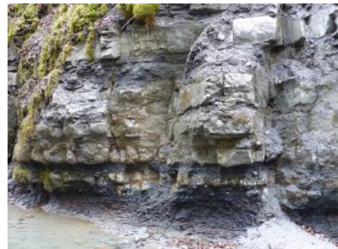
Unterjuragestein am Talhang des Aubachs nordwestlich von Blumberg-Aselfingen

Allgemein stellen die Unter- und Mitteljuragesteine des Albvorlands die Ablagerungen eines flachen, epikontinentalen Meeres dar, das sich im Zeitraum vor etwa 200–164 Mio. Jahren in Südwestdeutschland ausgebreitet hatte und aufgrund von Meeresspiegelschwankungen eine variable Küstenlinie besaß. Neben Küstennähe und den vom Festland teilweise erfolgten Einschwemmungen spielte auch die Gliederung des Meeresbodens durch Schwellen und Hochgebiete für die Ausbildung der Gesteine und deren Mächtigkeit eine Rolle (Geyer et al., 2011).