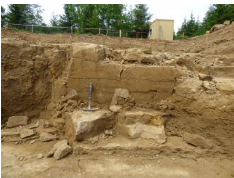
Angulatensandstein-Formation, Probeabbau bei Grosselfingen

Der Unterjura erreicht im Vorland der Mittleren Alb durchschnittliche Mächtigkeiten von 100–150 m. Nach Süden und im Bereich des Vorlands der Ostalb nimmt die Mächtigkeit deutlich bis auf Werte um 60 m ab. Zur Ablagerung kamen v. a. dunkle Ton- und Mergelsteine. Für die morphologische Gliederung der Landschaft sind die im untersten Abschnitt vorhandenen Kalksandsteine der Angulatensandstein-Formation wirksam, die allerdings südlich von Balingen aussetzen, und v. a. die darüber folgenden harten Kalksteinbänke der Arietenkalk-Formation.