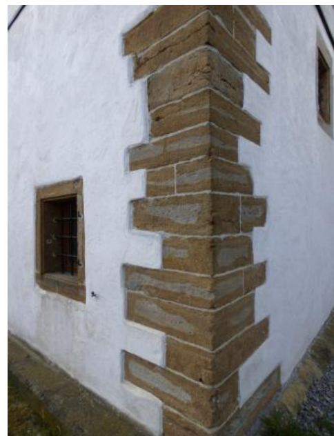
Mauerwerk aus Angulatensandstein in Balingen-Ostdorf

Aus dem Eisensandstein des Mitteljuras bei Weilheim a. d. Teck, Donzdorf und Lauchheim wurden Naturwerksteine gewonnen.