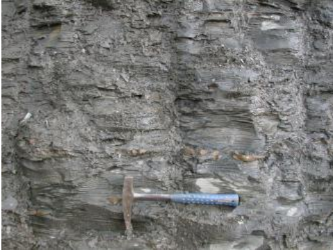
Tonstein der Opalinuston-Formation in einer Tongrube bei Weilen unter den Rinnen (westliches Albvorland)

Generell ist das Albvorland ein Grundwassermangelgebiet. Im gesamten Albvorland liegen die Ergiebigkeiten der Quellen unter 1 l/s. Eine Ausnahme ist die Eisensandstein-Formation im Vorland der Ostalb. Aus ihr entspringen Kluftquellen mit mittleren Schüttungen bis 5 l/s, in Ausnahmefällen bis 10 l/s. Örtlich werden die Grundwässer der Sandsteine und Kalksteine mittels Bohrungen erschlossen (Raum Aalen-Bopfingen), wobei Förderleistungen bis maximal 30 l/s erzielt werden.