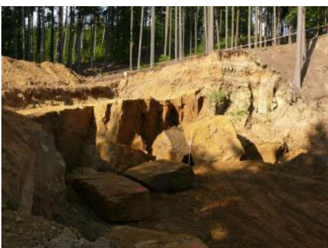
Eisensandstein mit weitständigem Kluftsystem (Steinbruch an der Banzenmühle bei Lauchheim)

Das Albvorland wird im Wesentlichen von Unterjura und Mitteljura aufgebaut. Diese Einheiten bestehen überwiegend aus gering durchlässigen Ton- und Mergelsteinen mit vereinzelt zwischengeschalteten, geringmächtigen und nur wenig Grundwasser führenden Sandstein- und Kalksteinlagen. Sie sind meist nur gering ergebnisreiche Kluft- und Porengrundwasserleiter (im Unterjura: Angulatensandstein-Formation, Arietenkalk-Formation, im Mitteljura: Wedelsandstein-Formation (Mittel- und Westalbvorland), Eisensandstein-Formation (Ostalbvorland)). Sie sind nur von lokaler wasserwirtschaftlicher Bedeutung.