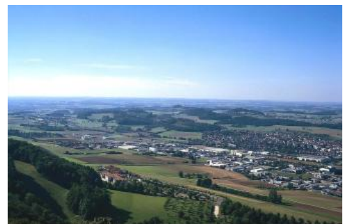
Blick vom Albrauf auf das Albvorland westlich von Aalen

Weitläufige, häufig stärker zerschnittene Platten aus Unterjuragesteinen mit teilweiser Lösslehmbedeckung ragen nördlich des Remstals, wie bei Mutlangen und der Frickenhofer Höhe , weit in das Keuperbergland hinein. Zum Albanstieg hin werden die Unterjuragesteine durch hügeliges Gelände in tonigen Mitteljuraschichten abgelöst, das sich in der Stufenrandbucht von Aalen zu einem ausgedehnten Hügelland weitert und als Welland bezeichnet wird. Besonderheiten im Vorland der Ostalb sind das Vorkommen der frühpleistozänen, fluviatil umgelagerten Goldshöfe-Sande und die mit dem miozänen Meteoriteneinschlag im Nördlinger Ries zusammenhängenden Auswurfmassen der Bunten Breckie, die schwerpunktmäßig entlang des Kraterrands, jedoch auch mit einem Einzelvorkommen westlich von Bopfingen auftreten.