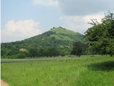
Die Vulkankuppe Limburg bei Weilheim an der Teck von Süden

Die häufig mehrschichtigen Lösslehmdecken setzten sich, begünstigt durch eine insgesamt geringe Höhenlage (ca. 320–400 m NN) der Landschaft, im Unterjura östlich des Neckars fort. Daran anschließend bildet der Mittlere Jura einen breiten Ausstrich mit einem Maximum zwischen Metzingen und Weilheim a. d. Teck. Das aus Ton- und Mergelsteinen gebildete Gelände wird von Hügeln und Hügelrücken eingenommen. Stellenweise eingeschaltete Sandsteinhorizonte führen örtlich zu ausgedehnteren, meist zerlappten Verebnungsbereichen. Eine weitere Gliederung erfährt der Anstieg des Albvorlands durch den Blaukalk im höheren Teil der Schichtenfolge. Dieser tritt hier verbreitet mit einer schmalen Stufe zu Tage, die örtlich, wie im Gebiet um Neuffen, in breite Verebnungen übergehen kann.