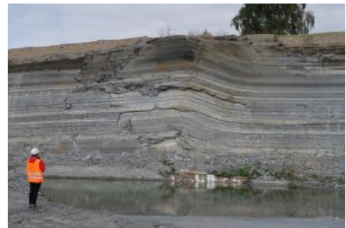
Posidonienschiefer-Formation, Abbauwand im Steinbruch Dormettingen (Zollernalbkreis)

Weiterführende Informationen zu den hydrogeologischen Verhältnissen im Albvorland finden sich in HGK (1985), Villingner (2011) sowie in Ad-Hoc-AG Hydrogeologie (2016).