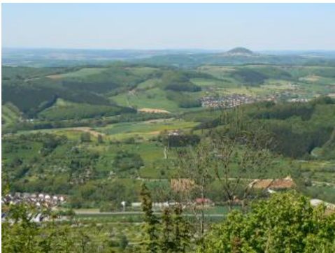
Östliches Albvorland nordöstlich von Eisingen/Fils (Lkr. Göppingen)

Charakteristisch sind in diesem Teil des Albvorlands die zahlreichen Vorkommen von vulkanischen Durchbruchsröhren des miozänen Albvulkanismus (Neumann, 1999). Darunter befinden sich mit dem Jusi an der Grenze zum Albanstieg eines seiner größten vulkanischen Gebilde und der Limburg , die vor dem Hintergrund des steilen Albanstiegs im Kirchheimer Becken als markanter Kegel aufragt, zwei besonders auffällige Erscheinungen. Das Kirchheimer Becken selbst wurde als Ausräumbereich von kleineren Flüssen und Bächen geschaffen, die in Traufbuchten des umgebenden Albanstiegs entspringen.