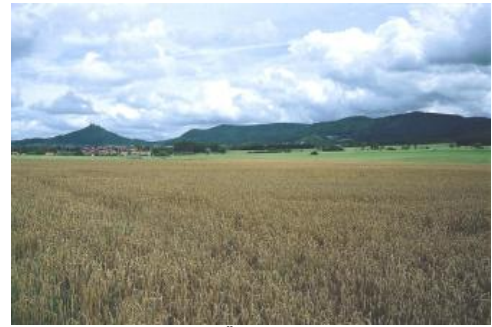
Ackerbaulich genutzte Ölschieferverebnung (Posidonienschiefer-Formation) bei Bisingsen-Steinhofen