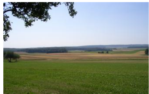
Flachwellige Landschaft am Südrand der Flächenalb nordwestlich von Ehingen

Die Nutzungsverteilung besteht auf der Kuppenalb heute aus einem Mosaik mit Waldflächen und Äckern sowie einzelnen extensiveren Grünlandbereichen in relief- und bodenbedingt ungünstigen Bereichen. Aus klimatischen Gründen steigt dagegen der Grünlandanteil in den hoch gelegenen Gebieten der Westalb merklich an. Ein grundsätzlich abweichendes Nutzungsbild zeigt sich im Bereich der mit Lösslehmen bedeckten Flächenalb, wo großflächiger, intensiver Ackerbau vorherrscht und Waldflächen meist auf die Randbereiche und Talhänge beschränkt sind.