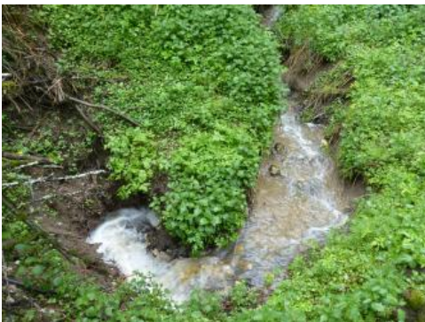
Ponor (Schluckloch) der Harreser Erdfälle (östlich von Neuhausen ob Eck)

Der Oberjura der Schwäbischen Alb beinhaltet eines der größten Grundwasservorkommen des Landes. Er besteht überwiegend aus verkarstungsfähigen, grundwasserführenden Massenkalken und Bankkalken. Die stärker verkarsteten Massenkalksteine bilden den Hauptgrundwasserleiter, die Grundwasservorkommen in den Bankkalken sind weniger ergiebig. Daneben gibt es gering ergiebige, wasserstauende Mergelsteinschichten (Impressamergel-Formation, Lacunosa-mergel-Formation, Zementmergel-Formation). Die Kalksteine wurden bereichsweise in Dolomit umgewandelt.