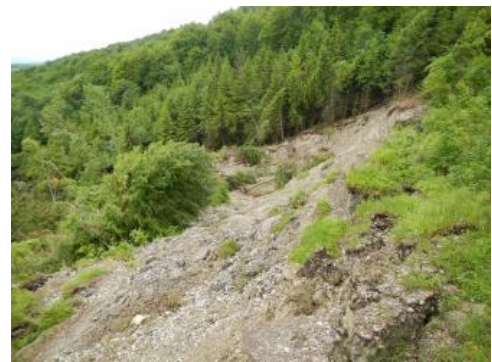
Große Rutschung östlich von Hechingen-Schlatt

Die großflächigen, tiefreichenden Rutschungen prägen das Erscheinungsbild der Albtraufhänge. Das prominenteste Beispiel einer solchen Rutschung ist der Bergrutsch am Hirschkopf bei Mössingen. In Steillagen können im Ausstrichbereich des Oberjuras ebenso Sturzereignisse ausgelöst werden. Als Beispiele hierfür sind der Felssturz von 2013 bei Ratshausen am Plettenberg (Albtrauf) sowie der Felssturz am Eichfelsen (nahe Beuron, Oberes Donautal) zu nennen.