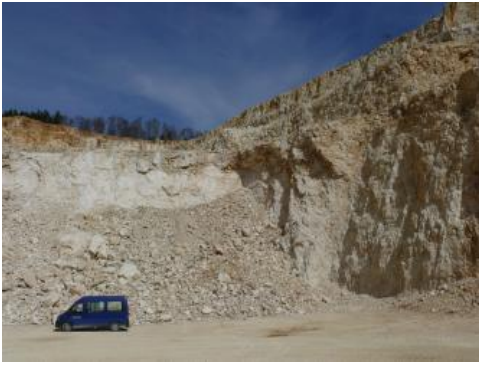
Die hochreinen Kalksteine mit einem \text{CaCO}_3 -Gehalt von über 99 % zählen zu den Industriemineralen.

Die wichtigsten und größten Lagerstätten hochreiner Kalksteine kommen im Oberjura der Schwäbischen Alb vor. Hochreine Kalksteine werden neben der Baustoffindustrie vor allem in der chemischen Industrie, der Lebensmittel- und Papierindustrie, besonders auch im Umweltschutz sowie in der Land- und Forstwirtschaft eingesetzt. Auf der mittleren und östlichen Schwäbischen Alb stellen die Karbonatgesteine der Zementmergel-Formation bzw. Mergelstetten-Formation des Oberjuras die Grundlage der Zementindustrie dar, da deren Zusammensetzung von Natur aus dem Portlandzement entspricht. Die Zementmergel im Raum Ulm stellen seit 1864 die Rohstoffbasis für die „Wiege der deutschen Zementindustrie“ dar.