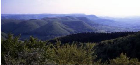
Oberjura-Schichtstufe (Albtrauf) bei Reutlingen (Blick vom Rossberg)

Die Schwäbische Alb steht mit ihrem mächtigen, sich mauerartig aus dem Vorland erhebenden Steilanstieg fast sinnbildlich für das Südwestdeutsche Schichtstufenland. Dabei stellt sie nur das oberste, allerdings besonders markante und eindrucksvolle Element des Stufenlands dar. Dieses hat sich im Wesentlichen seit dem jüngeren Tertiär im Zusammenhang mit der Entstehung des Oberrheingrabens herausgebildet. Noch zu Beginn des Tertiärs vor 66 Mio. Jahren befanden sich die heute das Stufenland aufbauenden mesozoischen Sedimentgesteine in einem horizontal lagernden, bis über 1000 m mächtigen Schichtenstapel, der das Grundgebirge in Süddeutschland