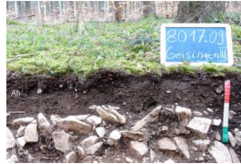
Rendzina auf verwittertem Kalkstein der Wohlgeschichtete-Kalke-Formation

Das Bodenmuster der Schwäbischen Alb wird vielfach durch Rendzinen bestimmt. Ihr geringmächtiger, dunkelgrauer bis schwarzer humoser Oberboden bildet einen auffälligen Kontrast zu dem darunter folgenden weißlichgrauen Kalkstein. Trotz der geringen Bodenmächtigkeit kommt es wegen des kühlen Klimas und den gegenüber den Vorländern im Schnitt erhöhten Niederschlägen nur selten zu Wassermangel für die Pflanzen. Einen weiteren charakteristischen Boden der Alb stellt die Terra fusca dar. Sie besteht hauptsächlich aus dem über längere Zeiträume angesammelten, nicht löslichen, tonigen Residualmaterial der Kalksteinverwitterung. Ihr oftmals leuchtend bräunlichgelbes bis rötlichbraunes Bodenmaterial wird teilweise noch von geringmächtigen lösslehmhaltigen Deckschichten überlagert, in denen meist Braunerden entwickelt sind. Terrae fuscae und zweischichtige Braunerde-Terrae fuscae ergänzen das von Rendzinen dominierte Bodenmuster.