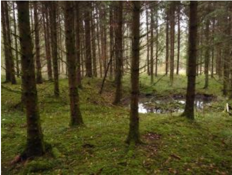
Bohnerzgruben im „Jungholz“ nordöstlich von Liptingen

Trotz ihrer relativen klimatischen Ungunst stellt die Schwäbische Alb eine altbesiedelte Landschaft dar, deren dauerhafte Besiedlung bis in das Neolithikum (Jungsteinzeit) zurückreicht. Andere Mittelgebirge mit ähnlichen Klimaverhältnissen wurden vielfach erst im Zuge der hochmittelalterlichen Landnahme als sog. Jungsiedelland erschlossen. Der bis in die Neuzeit anhaltende hohe Bedarf an landwirtschaftlicher Nutzfläche zur Ernährung der Albbevölkerung führte in vielen Gebieten der Alb zu einem früher wesentlich höheren Anteil von Acker- und Weideflächen und einem entsprechend geringeren Waldanteil. Dieser betrug gebietsweise sogar weniger als die Hälfte seines heutigen Umfangs. Verschiedene Entwicklungen, unter denen v. a. der allgemeine technologisch-wirtschaftliche Fortschritt bedeutend war, führten seit der ersten Hälfte des 19. Jahrhunderts zu einer grundlegenden Änderung des Nutzungsmusters mit einer insgesamt deutlichen Erhöhung des Waldanteils.