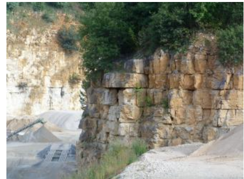
Kalksteine der Untere-Felsenkalke-Formation

Die Kalksteine des Unteren Weißjuras werden nach oben von den meist mehrere Zehnermeter mächtigen, wiederum mit Kalksteinbänken durchsetzten, grauen Mergel- und Kalkmergelsteinen der Lacunosamergel-Formation abgelöst (früher: Weißjura gamma). In ihrem Hangenden setzen erneut Kalksteine ein, die sich aus den gebankten Kalken der Untere und Obere Felsenkalke-Formation (früher: Weißjura delta und epsilon) und teilweise engräumig mit ihnen wechselnden massigen Riffkalken zusammensetzen. Die 20–60 m mächtigen Kalksteine der Untere Felsenkalke-Formation und die eingeschalteten Massenkalken treten landschaftlich als oft weithin sichtbare weiße Felskränze am Albtrauf sowie entlang einzelner von dort in den Albkörper zurückgreifender Täler in Erscheinung.