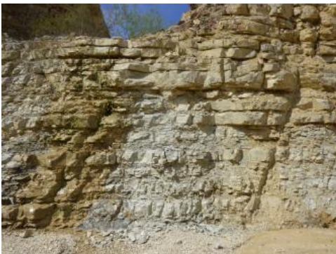
Hangende Bankkalke-Formation über Hattingen-Trümmerkalk, Abbauwand im Steinbruch Eigeltingen

In den darüber einsetzenden, bis über 200 m mächtigen Schichten des Oberen Oberjuras (früher: Weißjura zeta) dominieren gebankte Kalksteine. Die das Schichtpaket nach oben abschließenden Kalksteine der Hangende-Bankkalke-Formation erinnern mit ihrer intensiven Bankung dabei an die grob-mauerartige Ausbildung der Wohlgeschichtete Kalke-Formation des Unteren Oberjuras. Charakteristisch für den Oberen Oberjura sind die in seinem mittleren Abschnitt verstärkt auftretenden Mergel- und Kalkmergelsteine der Zementmergel- bzw. der sich mit Bankkalken verzahnenden Mergelstetten-Formation. Diese wurden in schüssel- und wannenartigen Senken zwischen riffartigen Erhebungen abgelagert, an deren Bildung im Bereich der Ostalb nun auch Korallen beteiligt waren. Die bis über 500 m betragende Gesamtmächtigkeit des Oberjuras, die aus Bohrungen unter schützender Bedeckung im Molassebecken