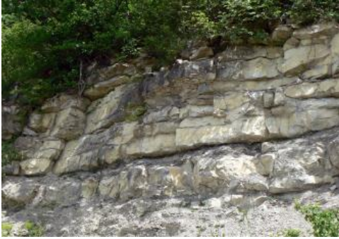
Bankkalke mit Mergelzwischenlagen im unteren Bereich der Wohlgeschichtete-Kalke-Formation am Pfaffenberg bei Bad Ditzgenbach-Auendorf

Im Gebiet der Schwäbischen Alb setzt die Schichtenfolge des Oberjuras (synonym: Weißer Jura) mit etlichen Zehnermetern von grauen, mit Kalksteinbänken durchsetzten Mergel- und Kalkmergelsteinen der Impressamergel-Formation ein (früher: Weißjura alpha), die neben ihrem Kalkanteil noch einen deutlichen Tongehalt besitzen. Sie bilden typischerweise auf der Traufseite den Sockel des Steilanstiegs der Alb und erreichen im Abschnitt der Mittleren Alb mit bis über 100 m ihre größte Mächtigkeit. Darüber folgen die auffälligen, vielerorts an Geländeanschnitten sichtbaren weißlich-hellgrauen Kalksteine der Wohlgeschichtete-Kalke-Formation (früher: Weißjura beta). Ihre meist nur wenige Dezimeter mächtigen Kalksteinbänke werden durch dünne Mergelfugen getrennt und erinnern an grobes Mauerwerk. Die Mächtigkeit der Wohlgeschichtete-Kalke-Formation beträgt grobenteils zwischen knapp 20 m und bis etwas über 30 m und