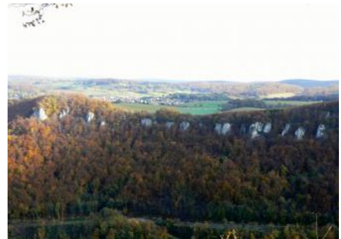
Blick über das obere Echaztal bei Lichtenstein-Honau zur Kuppenalb bei Lichtenstein-Holzelfingen

Nördlich der Klifflinie wird das Gelände von hügeligem Relief dominiert. Gesteinsunterschiede haben hier dazu geführt, dass die im Bereich von ehemaligen Riffkomplexen massig ausgebildeten Kalksteine aufgrund ihrer Widerständigkeit gegenüber Abtragung herauspräpariert wurden, während die geschichteten Gesteine der Zwischenriffbereiche erodiert wurden und Hohlformen hinterlassen haben. Ein teilweise engräumiger Wechsel von Hügeln und muldenförmigen Senken und Schüsseln charakterisiert daher das Relief der sog. Kuppenalb . Die geomorphologische Grundgliederung der Alblandschaft wird auf der Westalb und der südlichen Mittleren Alb durch z. T. weit terrassenartig vorspringende Verebnungen oberhalb des Steilanstiegs modifiziert, die von den gebankten Kalksteinen des Unteren Oberjuras (Wohlgeschichtete-Kalke-Formation) gebildet werden, bevor im rückwärtigen Bereich über eine weitere Stufe schließlich der Anstieg zur Kuppenalb erfolgt. Die Verebnungen verlaufen mehr oder weniger im Bereich der Schichtfläche der Wohlgeschichtete-Kalke-Formation, weshalb diese Relief- und Landschaftseinheit gelegentlich auch als Schichtflächenalb bezeichnet wird (Dongus, 1977).