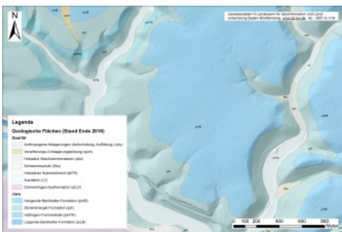
Digitales Geländemodell mit Verkarstungsstrukturen in Gesteinen des Oberjuras zwischen Tuttlingen und Engen

Die Hochfläche der Schwäbischen Alb wird vorwiegend von verkarstungsfähigen Karbonatgesteinen des Oberjuras gebildet. Auf der Schwäbischen Alb ist daher das Phänomen Verkarstung die am häufigsten auftretende geogene Naturgefahr. Verkarstungsstrukturen, wie Dolinen, Karstwannen etc. sind weit verbreitet. In Hanglagen wie z. B. am Albtrauf, dem Nordwestrand der Schwäbischen Alb, oder in Flusstälern treten zudem immer wieder gravitative Massenbewegungen auf. Zu Rutschungen neigen insbesondere die Gesteine im Grenzbereich des Mitteljuras zum Oberjura. Vor allem am Trauf der Mittleren und Westlichen Alb sind Hangrutschungen besonders häufig.