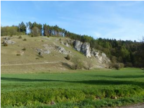
Trockental auf der Ostalb bei Neresheim (Dossinger Tal)

Auch die Ostalb , die meist Höhenlagen um 700 m NN aufweist, lässt sich wiederum in einen nördlichen Kuppenalb-Bereich ( Albbuch und Härtsfeld ) und die südlich gelegene Flächenalb untergliedern ( Lonetal-Flächenalb ). Lone und Brenz bilden die Hauptentwässerungsadern der Ostalb. Im Norden greift bei Aalen der Oberlauf des Kochers in den Albtrauf ein. Im Südosten grenzt die Ostalb an die breite Talniederung des Donaurieds und hat an der bayrischen Grenze noch einen geringen Anteil am Nördlinger Ries. Der viel kleinere, ebenfalls auf einem Meteoritenimpakt beruhende Krater des Steinheimer Beckens befindet sich etwa 30 km südwestlich davon mitten auf der Ostalb. Die an das Nördlinger Ries südlich anschließende und vollständig in Bayern gelegene Riesalb gehört gleichermaßen noch zur östlichen Schwäbischen Alb.