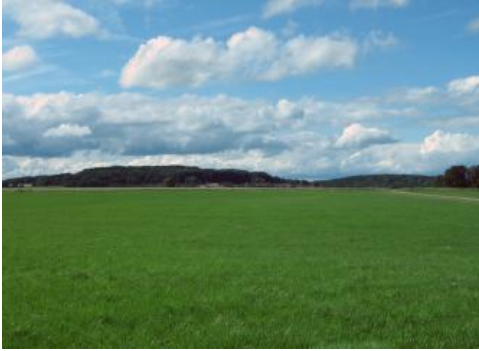
Blick von der Flächental bei Berghülen nach Nordosten zur Klifflinie

Im Untermiozän griff vor ungefähr 18 Mio. Jahren das Meer vom Molassebecken auf den südlichen Rand der Schwäbischen Alb über und drang bis zu 20 km weit auf die Albtafel vor. Im Brandungsbereich entstand eine Steilküste, deren Kliff sich entlang der sog. Klifflinie noch heute abschnittsweise gut erkennen lässt. Die Klifflinie markiert eine wichtige geomorphologische Grenze und gliedert die Schwäbische Alb in zwei grundlegende Landschaftseinheiten. Südlich davon wurde die frühe tropische bis subtropische Flachlandschaft der Alb unter Molasseablagerungen teilweise konserviert. Im Bereich der sog. Flächental herrschen deshalb überwiegend geringe Reliefunterschiede mit teilweise ausgedehnten Verebnungen vor. Mit zunehmender tektonischer Verkippung der Albtafel erfolgte später die Zerschneidung durch einzelne Täler (Semmel, 1996), was aber für die Auflösung der alten Flachlandschaft nicht ausreichte.