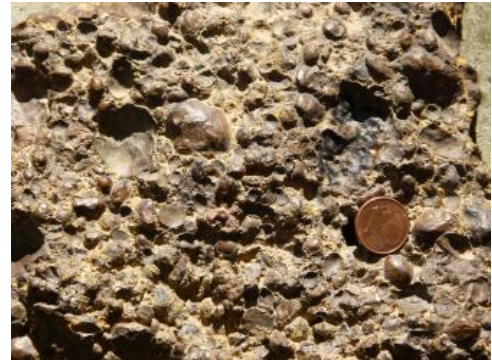
Die Bohnerze der Schwäbischen Alb sind kugelige Eisenkonkretionen.

Abgesehen von den Steine-Erden-Rohstoffen hatte die Eisenerzförderung auf der Schwäbischen Alb die größte Bedeutung. Gewonnen wurden in zahlreichen kleinen Gruben sog. Bohnerze. Diese Erze wurden bereits von den Kelten abgebaut und verhüttet. Sie waren ab dem 19. Jh. der Ausgangspunkt für die Eisen produzierende Industrie im Raum Königsbronn, Aalen, Geislingen und Blumberg.