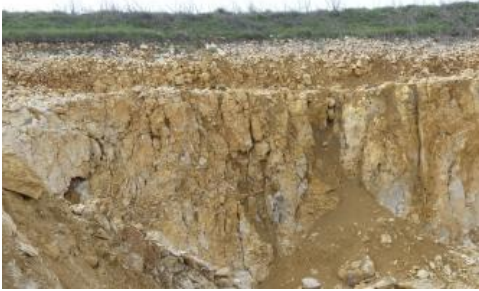
Verkarstete Massenkalksteine des Oberjuras (Steinbruch Buchheim, nordöstlich von Neuhausen ob Eck)

Der Oberjura der Schwäbischen Alb beinhaltet eines der größten Grundwasservorkommen des Landes. Er besteht überwiegend aus verkarstungsfähigen, grundwasserführenden Massenkalken und Bankkalken. Die stärker verkarsteten Massenkalksteine bilden den Hauptgrundwasserleiter, die Grundwasservorkommen in den Bankkalken sind weniger ergiebig. Daneben gibt es gering ergiebige, wasserstauende Mergelsteinschichten (Impressamergel-Formation, Lacunosa-mergel-Formation, Zementmergel-Formation). Die Kalksteine wurden bereichsweise in Dolomit umgewandelt.