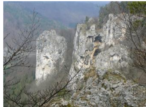
Felsbildungen aus Oberjura-Massenkalk östlich von Beuron

In der Zeit des Oberjuras bildete sich in Süddeutschland in einem subtropischen Randmeer eine Karbonatplattform. Kalkabscheidende Kleinlebewesen führten zur Ablagerung von Kalkschlämmen am Meeresboden, die durch Meeresströmungen weitflächig verdriftet wurden. Auf flachen Erhebungen und Schwellen des Meeresbodens wuchsen koloniebildende Lebensgemeinschaften aus Mikroben, Algen und Schwämmen zu riffähnlichen Strukturen auf. In diesem sedimentären Umfeld entstanden während des Oberjuras mächtige Karbonatgesteinsserien, die einerseits von gebankten Kalksteinen und andererseits von massigen Kalk- und Dolomitsteinen im Bereich der ehemaligen Riffe dominiert werden (Geyer et al., 2011).