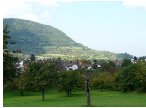
Traufhänge der Mittleren Alb nordwestlich von Unterlenningen

Der Landschaftsbegriff „Alb“ wurzelt vermutlich in einem indogermanischen Wortstamm, der für „Berg“ oder „Hochweide“ steht und sich im Übrigen auch im Gebirgsnamen „Alpen“ wiederfindet (Bumiller, 2008). Die exponierte und hohe Lage wird v. a. am Albtrauf deutlich. Dieser erhebt sich am Nordwestrand der Schwäbischen Alb als weithin sichtbare, bewaldete mauerartige Landschaftsstufe über das Vorland. An vielen Stellen sind dem zusammenhängenden Albkörper mehr oder weniger abgetrennte und isolierte Berge vorgelagert (Zeugenberge, Ausliegerberge). Hinter dem Trauf fällt die Alb mit ihrer bis zu 40 km breiten Hochfläche mit geringer Neigung nach Südosten hin ab, wo die Donau über eine große Strecke die Grenze zum Alpenvorland markiert.