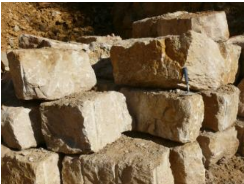
Quaderkalk der Unteren-Felsenkalk-Formation

Die wichtigsten und größten Lagerstätten hochreiner Kalksteine kommen im Oberjura der Schwäbischen Alb vor. Hochreine Kalksteine werden neben der Baustoffindustrie vor allem in der chemischen Industrie, der Lebensmittel- und Papierindustrie, besonders auch im Umweltschutz sowie in der Land- und Forstwirtschaft eingesetzt. Auf der mittleren und östlichen Schwäbischen Alb stellen die Karbonatgesteine der Zementmergel-Formation bzw. Mergelstetten-Formation des Oberjuras die Grundlage der Zementindustrie dar, da deren Zusammensetzung von Natur aus dem Portlandzement entspricht. Die Zementmergel im Raum Ulm stellen seit 1864 die Rohstoffbasis für die „Wiege der deutschen Zementindustrie“ dar.