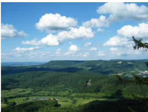
Oberjura-Schichtstufe (Albtrauf) bei Hechingen – Blick vom Raichberg nach Norden; Foto: N. Wannenmacher

Die Schwäbische Alb ist Teil eines überwiegend aus Kalksteinen des Oberjuras aufgebauten langen Zugs von Mittelgebirgen, der sich vom Oberlauf des Mains westlich des Fichtelgebirges bis in das Gebiet südwestlich des Genfer Sees erstreckt. Die Ausdehnung der Schwäbischen Alb reicht in Nordost-Südwest-Richtung vom Meteoritenkrater des Nördlinger Ries bis zum Randen nördlich des Hochrheins bei Schaffhausen. Sie verläuft damit über eine Entfernung von mehr als 200 km diagonal durch Baden-Württemberg und umfasst mit rund 5400 km 2 etwa ein Siebtel der Landesfläche. Östlich des Nördlinger Ries und des Unterlaufs der Wörnitz, die bei Donauwörth in die Donau mündet, wird die Schwäbische Alb von der Fränkischen Alb bzw. Frankenalb abgelöst. Südlich des Hochrheins folgt zunächst das Stufenland des Schweizer Tafeljuras, der nach Südwesten bald in den bereits durch die Alpenbildung beeinflussten Faltenjura übergeht.