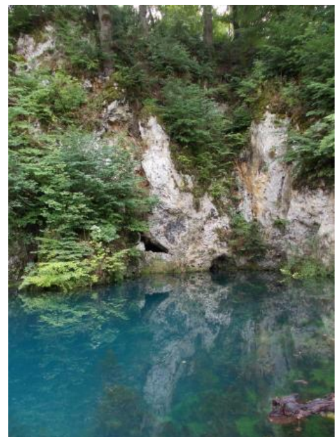
Brenztopf (Königsbronn, Lkr. Heidenheim)

Auf der Westalb sind die Quellen durch geringere Schüttungen (bis maximal 100 l/s) charakterisiert. Eine Ausnahme bildet die Aachquelle im Hegau. Sie ist mit einer mittleren Schüttung von ca. 8100 l/s die größte Quelle Deutschlands und hat ein Einzugsgebiet von über 300 km 2 . Die Gesamtschüttung besteht zu etwa zwei Dritteln aus Donauwasser, das bei Immendingen, Möhringen und Fridingen versickert. An ca. 120 Tagen im Jahr versickert die Donau auf diesem Flussabschnitt vollständig. Auf der mittleren Alb werden Quellen mit einigen 100 l/s (z. B. Gallusquelle: mittlere Schüttung ca. 470 l/s) und ergiebige Bohrungen (vor allem Schmiech- und Blautal, indirekter Karst des rißzeitlichen Donaurinnensystems bei Sigmaringen) hauptsächlich im tiefen Karst genutzt. Auf der Ostalb gibt es mehrere Quellen mit mittleren Schüttungen von über 1 m 3 /s. Beispiele hierfür sind die Brunnenmühlenquellen in Heidenheim, die Brenz- und Pfefferquelle in Königsbronn oder die Buchbrunnenquelle südlich von Dischingen.