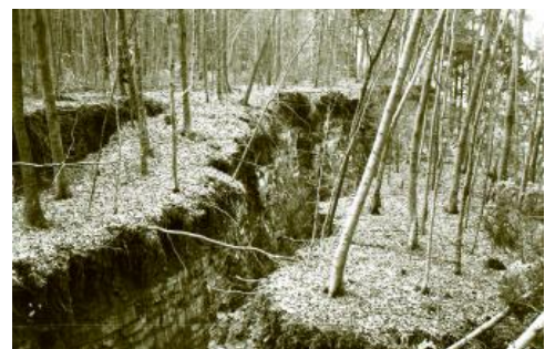
Abrutschende Festgesteinsschollen aus Kalksteinen der Wohlgeschichtete-Kalke-Formation des Bergrutsches am Hirschkopf bei Mössingen vom 12.04.1983

Lithologisch ist das durch Massenbewegung umgelagerte Material sehr heterogen. Je nach Ausgangsgestein und Massenbewegungsprozess können alle Zusammensetzungen von einem homogenen Ton bis zu nahezu unverwitterten und im Verband abgerutschten Festgesteinsschollen bzw. zu Steinen bis Blöcken zertrümmerten Festgesteinen vorkommen.