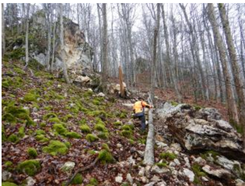
Sturzmassen aus Kalksteinen der Unteren Massenkalke