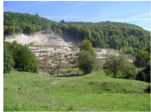
Rutschmasse der Rutschung Mössingen-Öschingen am Trauf der Schwäbischen Alb vom 02.06.2013