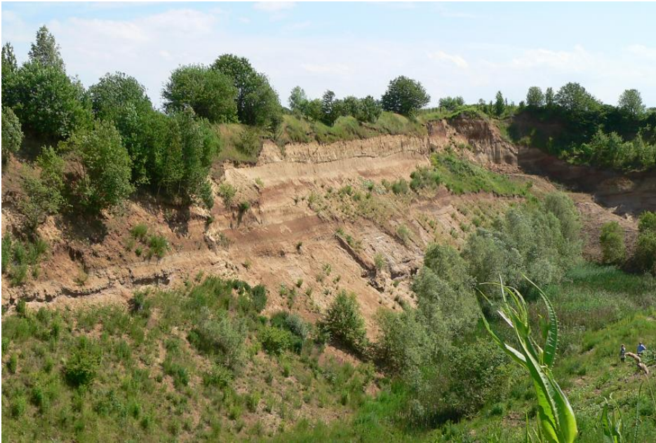
Abbauwand einer aufgelassenen Kiesgrube bei Heilbronn-Frankenbach – Mehrgliedriges Lösssediment über Frankenbach-Schotter