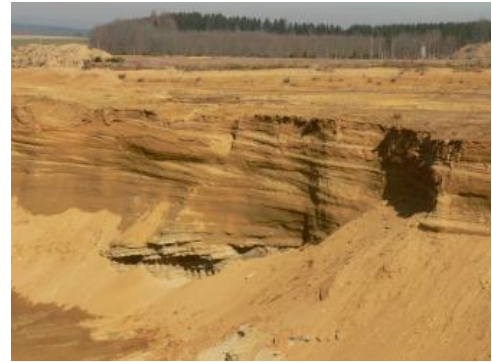
Abbauwand des Grobsandzugs mit Schrägschichtung

An Sedimentgesteinen überwiegen im Molassebecken festländische klastische Gesteine (Sandsteine, am Beckenrand auch Konglomerate) mit Glimmer, pedogen überprägte Schluffsteine und bunte Mergel. Linnische Mergel und Karbonate sowie Calcretes kommen untergeordnet vor. Dagegen sind marin gebildete Glaukonitsandsteine und sandige Mergel oder Tonmergel des jüngeren Molassemeeres weit verbreitet und sehr mächtig. Die Küstenfazies in Form von groben Schillkalksteinen oder grobkiesigen Rinnenfüllungen ist nur lokal erhalten. Gegliedert wird die Molasse in sechs Untergruppen: die Untere Meeresmolasse, die Untere Brackwassermolasse (beide im Landesgebiet nur im tieferen Untergrund verbreitet), die Untere Süßwassermolasse , die Obere Meeresmolasse , die Obere Brackwassermolasse und die Obere Süßwassermolasse .