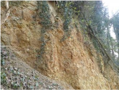
Buntmergel der Pechelbronn-Fm. von Lahr-Dinglingen

Je nach Lokalität sind die Mächtigkeiten der Tertiärsedimente sehr unterschiedlich: im Molassebecken sind es wenige Meter im Norden bis über 5000 Meter im Süden, im Oberrheingraben bis mehrere tausend Meter mit oft starken Unterschieden auf benachbarten tektonischen Schollen. Die ansonsten im Land verteilten lokalen Vorkommen tertiärer Einheiten bleiben in der Regel auf wenige Meter, in seltenen Fällen auf einige 10er Meter beschränkt (Maarsee-Ablagerungen, Höhenschotter). In den Meteoritenkratern überschreiten Impaktgesteine inklusive der Kraterseeablagerungen 100 m Mächtigkeit, wohingegen die Volumina der ausgeschleuderten Schollen sehr heterogen sind.