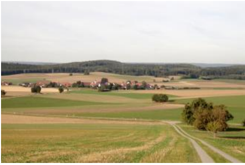
Blick vom nördlichen Anstieg des Bussens auf das Tertiärhügelland bei Unlingen-Dietelhofen

Die tertiären Einheiten sind im Land (LGRB, 2016c) räumlich sehr weit verbreitet, jedoch meistens von Sedimenten des Quartärs bedeckt. In größerer Mächtigkeit kommen sie in drei Hauptregionen vor.