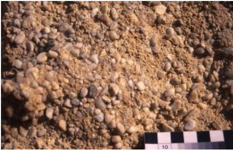
Feinkiesige, mittel- bis grobsandige Grimmeltinger Graupensande

Die Obere Brackwassermolasse wird in Bayern auch als Süßbrackwassermolasse bezeichnet.