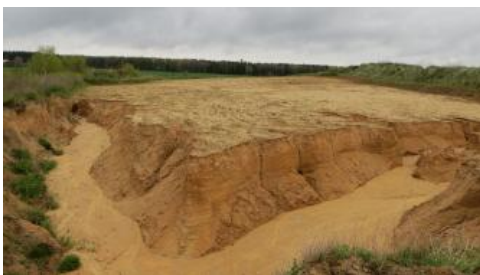
Quarzsande der Grimmelfinger Graupensande in einer Sandgrube bei Erbach-Ringingen

Die Erosionskraft des Flusses war gewaltig. Er räumte den Untergrund bis in die Untere Süßwassermolasse, bereichsweise sogar bis in die jurassischen Karbonate aus und schuf ein 8–13 km breites und bis rund 80 m tiefes Tal, die sogenannte „Graupensandrinne“. Nur im westlichen Bodenseeraum und über den Klettgau zum Mündungsbereich in das noch länger bestehende Meer des heutigen Schweizer Mittellands war das Tal des Graupensandflusses flacher, dafür aber bis auf etwa 20 km ästuarin verbreitert.