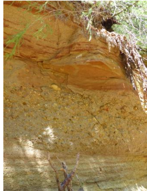
Graupensande, Austernkonglomerat und Melaniensande in der Sandgrube von Riedern am Sand (Klettgau)

Die Verschüttung der Graupensandrinne beginnt mit der Grimmelfingen-Formation , die diskordant auf älteren Molasseeinheiten sowie jurassischen Kalken auflagert. Sie besteht aus nur wenige Meter mächtigen, locker gelagerten fluvialen Feinkiesen und Grob- bis Mittelsanden mit Feinkiesanteil, die auch als „Graupensand“ bekannt sind. Das Sediment ist kalkfrei und meist grau oder braungelb gefärbt. Gegen oben gehen die Kiese in kalkfreie, glimmerführende Feinsande über („suevicus Sande“), die bis 13 m mächtig werden, jedoch nicht als eigenständige Subformation geführt werden.