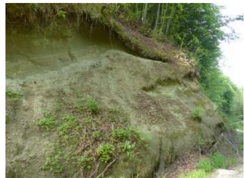
Molasse-Aufschluss an der Eichhalde bei Hohenfels-Kalkofen – Obere Brackwassermolasse über Oberer Meeresmolasse

Die Ablagerung der Oberen Brackwassermolasse erfolgte innerhalb eines sehr kurzen Zeitabschnitts, dem jüngsten Oligän, etwa von 17,4 bis 17 Mio. Jahren (frühes Miozän).