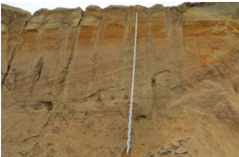
Abbauwand mit schräggeschichteten, feinkiesigen Mittel- bis Grobsanden der Grimmelfinger Graupensande

Zusammen werden die Schichten der Oberen Brackwassermolasse bis rund 45 m mächtig, wobei auf die Grimmelfinger-Formation örtlich bis 20 m und auf die Kirchberg-Formation bis etwa 25 m entfallen. Die fluvialen feinkiesigen Graupensande erreichen maximal etwa 6 m. Die Samtsande nördlich des Überlinger Sees erreichen bis ca. 10 m Mächtigkeit.