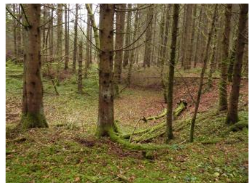
Bohnerzgruben im „Jungholz“ nordöstlich von Liptingen

Residuallehme finden sich überwiegend auf den Hochflächen über verkarstungsfähigen Karbonatgesteinen als unlöslicher Rückstand der Lösungsverwitterung. Sie sind besonders über Kalksteinen und Dolomitsteinen des Muschelkalks und Oberjuras, seltener auf Kalksteinen des Unterjuras anzutreffen, und folgen als geringmächtige lehmige Hülle dem Relief der Stufenfläche. Sie füllen dabei auch Karstschlotten und Spalten, deren Relief sie dadurch teilweise verdecken, oder finden sich umgelagert in alten Höhlen unterhalb der Festgesteinsoberfläche. Am weitesten verbreitet sind tertiäre Residuallehme auf der Albhochfläche, besonders auf der Ostalb, und im Kraichgau sowie auf Teilen der Gäu- und Filderflächen. Auch im Untergrund des Alpenvorlandes wurden sie unter den Molasseablagerungen an der Oberfläche der Oberjura-Kalksteine in Bohrungen angetroffen.