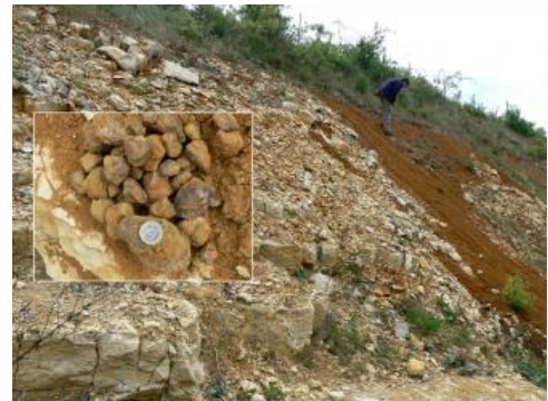
Lehmverfüllte Karstspalte mit Bohnerzen bei Engen

Da die Residuallehme meist ein Karstrelief ausgleichen, kann die Mächtigkeit auf wenige Meter Entfernung zwischen wenigen Zentimetern und bis über 20 m schwanken.