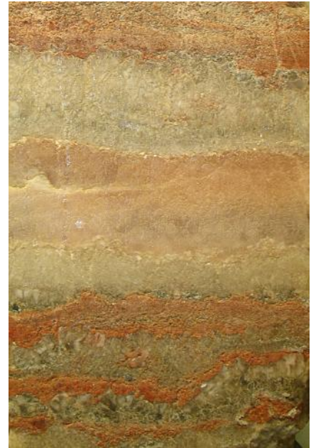
Kalisalz aus Buggingen (Sammlung LGRB)

Die größte Mächtigkeit erreicht das Oberrheingraben-Tertiär im Raum Rastatt mit über 3000 m. Der genaue Wert ist nicht bekannt, da das Tertiär hier bisher nicht durchbohrt wurde und die Tiefenlage des Mesozoikums daher nur aus geophysikalischen Erkundungen berechnet werden kann. Im größten Teil des Grabeninneren erreichen die Mächtigkeiten etwa 1000–2000 m, wobei die meisten Formationen jeweils mehrere Hundert Meter Mächtigkeit einnehmen können. Im Randschollengebiet nahe der Grabenränder, das teilweise von geringmächtigen Quartärsedimenten verdeckt ist, schwanken die Mächtigkeiten auf engem Raum stark, da sich die Randschollen während der Sedimentation unterschiedlich stark abgesenkt haben und das Tertiär vielfach vor der quartären Überlagerung teilweise wieder erodiert worden ist.