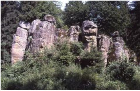
„Blauer Stein“ auf der Hegaualb bei Blumberg (Schwarzwald-Baar-Kreis)

Bei den Jüngeren Magmatiten finden sich Lavaströme und an der Erdoberfläche abgesetzte Tuffe nur im Kaiserstuhl und im Hegau. Bei den übrigen Vorkommen handelt es sich um Tuffbrekzien und subvulkanische Schlotfüllungen, seltener auch um Gangintrusionen mit etwas unterschiedlicher, jedoch stets ultrabasischer Zusammensetzung. Die Tuffbrekzien stellen meist eine Mischung von Nebengesteinsfragmenten und vulkanischem Material dar, doch gibt es besonders im Kaiserstuhl und im Hegau auch reine Tuffe und Lapillituffe mit nur geringen Beimengungen von Nebengesteinen.