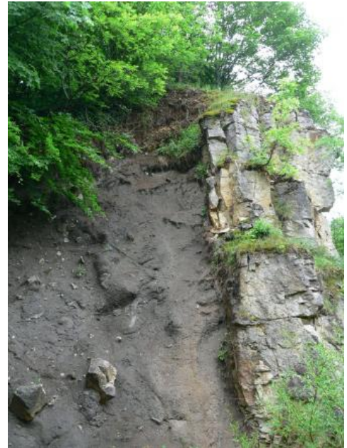
Tuffschlot bei Neuffen in Kontakt mit Oberjura-Kalkstein

Die Alb-Magmatite sind durch die zahlreichen, das Gebirge durchschlagenden Eruptionsröhren charakterisiert, welche größtenteils mit ungeschichteten diamikten Brekzientuffen gefüllt sind. Diese pyroklastischen Brekzientuffe bestehen aus vulkanischem Material (Asche, Lapilli und Bomben) sowie aus Trümmern von Trias- und Juragesteinen, vereinzelt auch aus Rotliegend- und Kristallintrümmern, die durch die Eruption des Vulkans z. T. aus großen Tiefen empor gefördert wurden. Das vulkanische Material ist durch das Auftreten einzelner Kristalle von mafischen Mineralen wie Biotit, Hornblende, Augit und Olivin, jedoch überwiegend durch zersetzten Glastuff charakterisiert (Geyer et al., 2011). Je nach auftretendem Mineralbestand können die feldspatfreien Gesteine als melilithführende Olivin-Nephelinite, Olivin-Nephelinite oder auch Hornblende-Pyroxenite bezeichnet werden (Geyer et al., 2011).