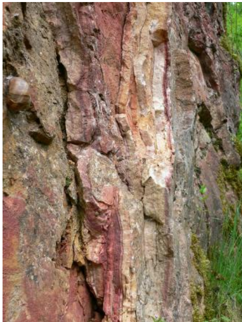
Böttinger „Marmor“ – Aufgelassener Steinbruch am nördlichen Ortsende von Münsingen-Böttingen

Die Maarsedimente bestehen aus feingeschichteten dunkelgrauen Ton- und Kalkmergelsteinen, sowie teilweise aus bituminösen Ölschiefen. Die Sedimente sind meist fossilführend mit zahlreichen Pflanzenresten und einer reichhaltigen Fauna.