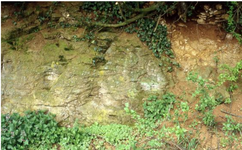
Aufschluss eines zu den Rheingrabenrand-Magmatiten gehörenden Tuffschlotes bei Ebringen

Die Rheingrabenrand-Magmatite und Südschwarzwald-Magmatite sind Schlot- und Gangfüllungen. Tuffschlote der Rheingrabenrand-Magmatite bestehen teils aus Tuffen oder Brekzientuffen, örtlich auch aus Brekzien mit sehr geringen Tuffanteilen. Die magmatischen Ganggesteine sind schwarzgraue, dichte oder schwach porphyrische Vulkanite (melilithführende Olivin-Nephelinite, vgl. Wimmenauer et al. 2010).