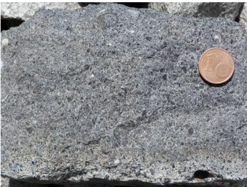
Essexit, ein magmatisches Ganggestein im Kaiserstuhl