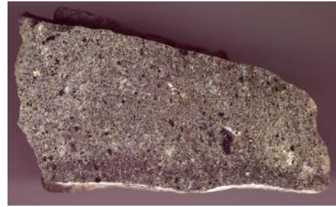
Phonolith aus Bötzingen

Die Vulkanite des Kaiserstuhls sind in der Formation der Kaiserstuhl-Magmatite zusammengefasst. Das Vulkanitmassiv wird überwiegend von Tuffen, pyroklastischen Brekzien und Lapillituffen, Laven und Ganggesteinen aufgebaut, unter denen nach ihrer Zusammensetzung Tephrite, Basanite, Phonolithe und Nephelinite sowie Essexite und Theralite unterschieden werden können. Vulkanische Tuffe und Tuffbrekzien sind die Polygenen Pyroklastite des östlichen Kaiserstuhls. Laven aus Limburgit und Basanit treten im westlichen Teil des Vulkanitmassivs auf, ebenso Olivinnephelinit-Laven und Pyroklastite. Weit verbreitet sind Tephrit-Laven und Pyroklastite. Subvulkanische Gesteine im Zentralbereich des Kaiserstuhls sind überwiegend Essexite und Theralite, die meist in Stöcken und Gängen auftreten. Dazu gesellen sich dort auch trachytische und phonolitische subvulkanische Gesteine. Zum Teil treten subvulkanische Brekzien auf. Eine Besonderheit stellen Vorkommen von Karbonatit dar, einem Vulkanit mit hohem Anteil an Calcit und Kalksilikatmineralen, der aus einer Schmelze erstarrt ist. Am Kontakt mit den umgebenden Tertiärsedimenten kam es örtlich zur kontaktmetamorphen Bildung von Hornfels („Bandjaspis“), auf der Karte dargestellt als Kontaktmetamorphes Tertiär. Vereinzelt sind tuffitische oder konglomeratische Umlagerungssedimente zwischen den Vulkaniten eingeschlossen, in denen auch tertiäre Fossilien gefunden wurden.