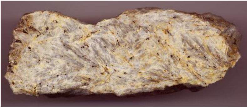
Karbonatit aus Vogtsburg-Schelingen