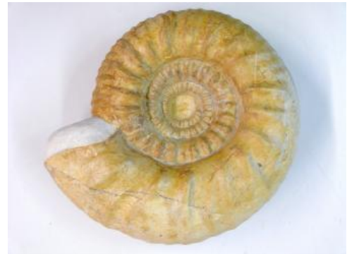
Gravesia gravesiana d'ORBIGNY, Hangende-Bankkalke-Formation; Steinbruch bei Emmingen-Liptingen; Foto: M. Kutz

Der Oberjura umfasst die internationalen Stufen vom Oxfordium bis zum Tithonium (163,5–145 Mio. Jahre vor heute), wobei in Baden-Württemberg die Basis des Oxfordiums über einer Schichtlücke bereits in der jüngsten Formation der Braunjura-Gruppe liegt. Im Gegensatz zum Fränkischen Jura ist in der Schwäbischen Alb nur das Unter-Tithonium erhalten. An der Obergrenze zum Tertiär besteht im Landesgebiet eine Schichtlücke von rund 100 Mio. Jahre.