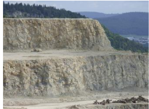
Impressamergel und Wohlgeschichtete Kalke (Untere Oberjura); Steinbruch am Plettenberg bei Dotternhausen

Die marinen Ablagerungen im Oberjura bestehen überwiegend aus Bankkalksteinen mit oder ohne Mergelstein-Zwischenlagen, (Kalk-)Mergelsteinen und wenig bis nicht geschichteten Massenkalken. Letztere sind teilweise diagenetisch in Dolomit umgewandelt, der nachfolgend dedolomitisiert und in Zuckerkornkalk umgewandelt ist. Die Kalksteine sind frisch hellgrau, verwittert hellbeige bis weiß, die Mergelsteine dunkelgrau bis grau. Durch den häufigen seitlichen Wechsel mächtigerer Massenkalken und weniger mächtiger Bankkalk-Fazies entstehen besonders im mittleren und oberen Oberjura starke kleinräumige Mächtigkeitsunterschiede.