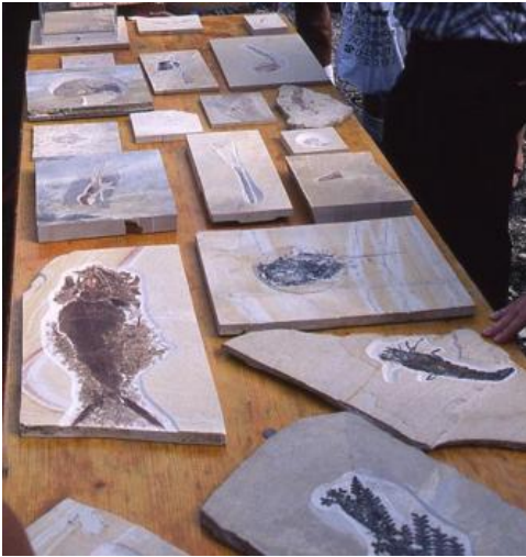
Fossilien aus der Nusplinger-Formation

Aus dem für den gesamten Jura geltenden Fossilreichtum, bestehend aus Ammoniten, Brachiopoden, Echinodermenresten etc. ragt die Fossilagerstätte des Nusplinger Plattenkalks heraus, die in einer tropischen Lagune des Jurameeres entstand. Ihre Berühmtheit verdankt sie vielen einzigartigen Versteinerungen, darunter Haie („Meerengel“) und andere Fische, Krebse, Meereskrokodile, Flugsaurier, Riesenlibellen und Landpflanzenreste (Dietl & Schweigert, 2011). Ob die dort gefundene, weltweit älteste Feder eine Vogel- oder Saurierfeder ist, konnte bisher nicht eindeutig geklärt werden.