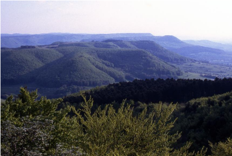
Oberjura-Schichtstufe (Albtrauf) bei Reutlingen (Blick vom Rossberg)