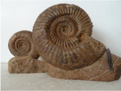
Parkinsonia sp., Leptosphinctes sp., Sengenthal-Formation, Bopfingen-Oberdorf

Der Obere Mitteljura vertritt das Bathonium, Callovium und Teile des Unter-Oxfordiums (Cordatum-Zone). Hierbei umfasst die Dentalienton-Formation die Zigzag-Zone des Unter-Bathoniums und die Variansmergel-Formation das Mittel- und Oberbathonium. Letztere sind in den Gebieten, wo die Variansmergel-Formation nicht entwickelt ist, eine Schichtlücke. Lediglich der Orbis-Oolith an der Basis des Macrocephalenooliths entspricht der Orbis-Zone des Oberbathoniums. Der Macrocephalen-Oolith s. str. und der Ornatenton sowie die Wutach-Formation vertreten das Callovium (Herveyi- bis Lamberti-Zone), der Glaukonitsandmergel die Cordatum-Zone des Unter-Oxfordiums.