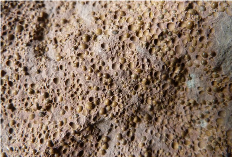
Eisenoolith, Wutach-Formation, Blumberg; Durchmesser der Ooide: 0,5–1,5 mm