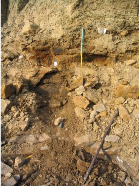
Baugrube in der Sengenthal-Formation, Neubaugebiet Lauchheim-Röttingen

Im Wutachgebiet ist über der Dentalienton-Formation die nach Norden und Nordosten rasch auskeilende Variansmergel-Formation zwischengeschaltet. Diese wird überlagert vom Orbis-Oolith und der Wutach-Formation , die aus einer mehrere Meter mächtigen Eisenoolith-Abfolge, überlagert von Glaukonitsandmergel, besteht.