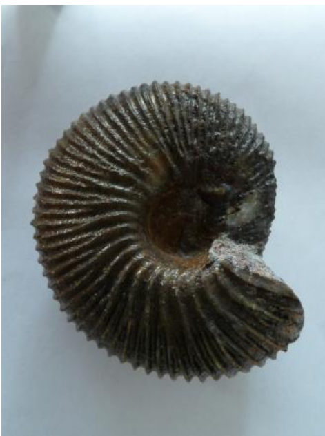
Macrocephalites sp., Wutach-Formation, Blumberg

Der Ferrugineus-Oolith, der eisenoolithische oberste Abschnitt der Hauptrogenstein-Formation entspricht im südlichen Oberrheingebiet zeitlich der Dentalienton-Formation. Darüber beginnt dort der Obere Mitteljura mit der Variansmergel-Formation, über welcher die Ornatenton-Formation folgt. Diese wird eingerahmt vom Macrocephalen-Oolith an der Basis und dem Anceps-Oolith am Top. Den hangenden Abschluss des Mitteljuras bildet die aus Tonstein bis Tonmergelstein bestehende Kandern-Formation .