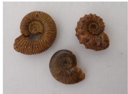
Ammoniten (sog. Goldschnecken), Ornatenton-Formation, Heubach südlich Gammelshausen

Die Eisenoolithen der Wutach-Formation wurden bei Blumberg und Gutmadingen bis in die 1940er Jahre bergmännisch abgebaut.