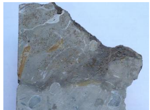
Wutach-Formation über Variansmergel-Formation; TB 2, Immendingen

Im Wutachgebiet ist über der Dentalienton-Formation die nach Norden und Nordosten rasch auskeilende Variansmergel-Formation zwischengeschaltet. Diese wird überlagert vom Orbis-Oolith und der Wutach-Formation , die aus einer mehrere Meter mächtigen Eisenoolith-Abfolge, überlagert von Glaukonitsandmergel, besteht.