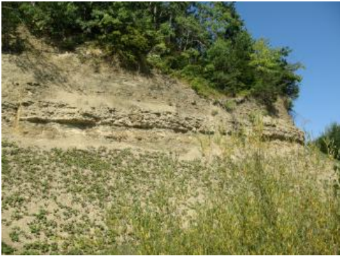
Unterer Muschelkalk, Freudenstadt

Der Untere Muschelkalk ist in Baden-Württemberg durch dreierlei fazielle Ausbildungen charakterisiert, deren Grenzen schräg durch die Schichtenfolge verlaufen und von denen daher vielfach zwei übereinander die lokale Profilentwicklung bestimmen. Die größte Verbreitung weist dabei eine Ausbildung als Abfolge von dolomitischen Mergelsteinen und Dolomitsteinbänken auf, die beiderseits des Zentralschwarzwaldes den gesamten unteren Muschelkalk ausmacht und daher als Freudenstadt-Formation bezeichnet wird. Im unteren Teil der Abfolge reicht die Verbreitung dieser Fazies bis in das Bauland (Raum Mosbach) und wird dort von Kalksteinen der Jena-Formation überlagert, die dort den mittleren bis oberen Teil und im Tauberland den gesamten Unteren Muschelkalk vertritt. Die Jena-Formation besteht dort ähnlich wie im Thüringer Typusgebiet oder im angrenzenden Unterfranken aus einer Abfolge von Wellenkalken und