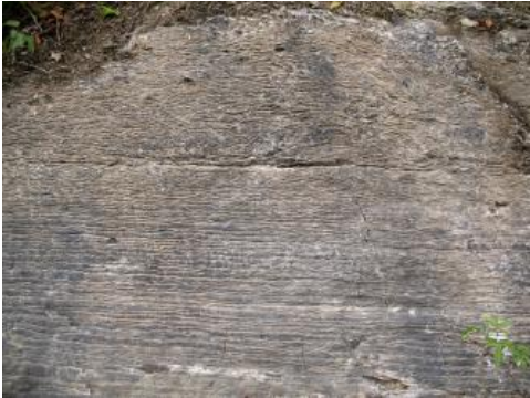
Wellenkalke im Unteren Muschelkalk, Wenkheim

Der Untere Muschelkalk wurde lange nach seinem auffälligsten Gestein, dem Wellenkalk (dünn-schichtige Kalksteine mit wellenartiger Verformung der Schichtflächen) als „Wellengebirge“ bezeichnet, wobei auf älteren Karten oft zwischen „Wellenkalk“ (im höheren Teil) und „Wellendolomit“ (im tieferen Teil) unterschieden wird. Die Grenze zwischen diesen beiden Untereinheiten war aber nicht einheitlich angesprochen worden und meint teils die Faziesgrenze zwischen Freudenstadt- und Jena-Formation und wurde andererseits teils an einer Leitschicht gezogen, unabhängig von der lokalen Faziesausbildung.