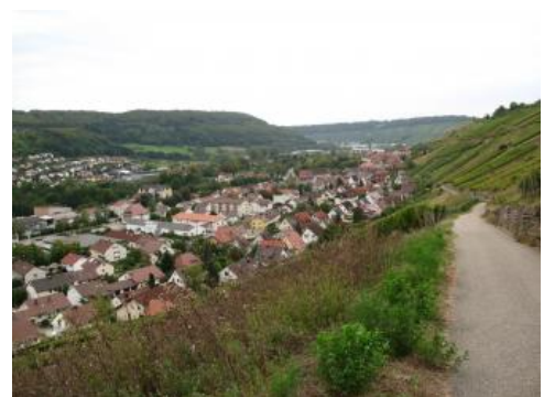
Kochertal bei Ingelfingen

Der Untere Muschelkalk weist in Baden-Württemberg meist nur schmale Ausstrichgebiete auf, in denen er nur im Norden des Landes (Tauberland, Hohenlohe, Bauland), d. h. im Gebiet der Kalkstein-Fazies, eine deutliche Schichtstufe ausbildet. Auch in den Talabschnitten von Kocher und Jagst, in denen sich diese Flüsse bis in den Unteren Muschelkalk eingeschnitten haben, zeigt sich eine Hangversteilung unter den etwas flacheren Talhangabschnitten des Mittleren Muschelkalks. In der tonig-dolomitischen Freudenstadt-Fazies in der Umrandung des Schwarzwaldes bildet der Untere Muschelkalk dagegen eher ein flaches Hügelland über der Buntsandstein-Hochfläche und unterhalb der Schichtstufe des Oberen Muschelkalks. Das Landschaftsbild ändert sich daher im Unteren Muschelkalk so stark wie in kaum einer anderen Untergruppe der Trias mit der Fazies, von Felsen bildenden Wellenkalken im Norden zu den Rutschhängen der Ühlingen-Fazies am Hochrhein.