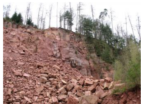
Unterer Buntsandstein (Miltenberg-Formation) bei Eberbach

Ablagerungen des Unteren Buntsandsteins streichen in Baden-Württemberg im zentralen und nördlichen Schwarzwald, südlichen und nördlichen Kraichgau, im Odenwald und im Main-Tauber-Gebiet aus. Der Untere Buntsandstein keilt im Mittleren Schwarzwald südlich von Elz und Breg zwischen Äquivalenten des Mittleren Buntsandsteins und Grundgebirges aus. Der Untere Buntsandstein bildet meist den unteren Anstieg zur Buntsandstein-Schichtstufe oder der in den Buntsandstein eingeschnittenen Talhänge, ohne selbst deutlich im Landschaftsbild hervorzutreten. Im Zentralschwarzwald und Kristallinen Odenwald finden sich jedoch örtlich Erosionsrelikte von Unterem Buntsandstein auf Kristallin oder permischen Gesteinen.