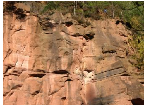
Buntsandstein bei Teningen-Heimbach

Die Perm-Trias-Grenze der internationalen Zeitskala ist in Thüringen einige Meter über der Buntsandstein-Basis festgestellt worden, weshalb sie für Südwestdeutschland entweder in der tieferen Eck-Formation bzw. im Heigenbrücken-Sandstein oder, falls es darunter eine Schichtlücke geben sollte, an deren Basis zu vermuten ist. Der Untere Buntsandstein entspricht demnach weitgehend der Indusium-Stufe der Frühen Trias. Ob im obersten Abschnitt der Miltenberg-Formation bereits die Olenekium-Stufe erreicht ist, lässt sich derzeit nicht sicher feststellen.