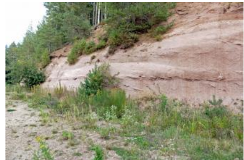
Mürbe Sandsteine der Eck-Formation in der Sandgrube Sommerau bei Obersteinhalden, Sankt-Georgen-Brigach.

Die Korrelation der südwestdeutschen Sandsteinfazies mit der Unterteilung des stärker von Tonsteinen geprägten norddeutschen Buntsandsteins im Unteren, Mittleren und Oberen Buntsandstein war im 19. und im größten Teil des 20. Jahrhunderts sehr unsicher. Die Zechstein-Randfazies wurde dabei lange als „Unterer Buntsandstein“ eingestuft, weshalb der heutige Untere Buntsandstein vielfach zum „Mittleren oder Hauptbuntsandstein“ gerechnet wurde. In den 1980er Jahren wurde der Umfang des „Unteren Buntsandstein“ zunächst um Eck-Formation und Badischen Bausandstein erweitert, in den 1990er Jahren dann der Tigersandstein des Schwarzwaldes als Zechstein-Randfazies aus dem Buntsandstein ausgegliedert. Schließlich hat man erkannt, dass der Badische Bausandstein in der kartographischen Abgrenzung auch Äquivalente des Mittleren Buntsandsteins umfasst. Der zeitweilige Versuch, innerhalb dieser „Großen Bausandstein-Formation“ einen „Bausandstein s. str.“ ohne Anteile des Mittleren Buntsandsteins abzugrenzen, zeigte sich als nicht praktikabel, weshalb inzwischen die Äquivalente des höheren Unteren und des Mittleren Buntsandsteins im Schwarzwald zu einer Formation zusammengefasst sind, die den von Alberti (1834) dort für diese Schichten eingeführten Namen Vogesensandstein wieder aufnimmt.