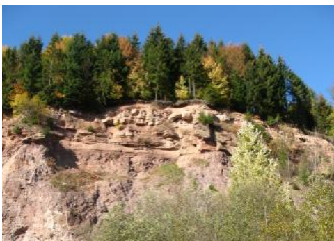
Zechstein-Randfazies auf Grundgebirge, Klosterreichenbach

Im Schwarzwald und Odenwald streichen die Gesteine des Zechsteins gewöhnlich an den Hängen unterhalb der Buntsandstein-Schichtstufe aus, ohne eigenständige Landschaftsformen zu bilden. Das Verbreitungsgebiet der eigentlichen Zechstein-Gruppe (des Mitteleuropäischen Beckens) beschränkt sich dabei auf die Gebiete nördlich etwa von Freiburg im Breisgau und St. Georgen im Schwarzwald. Ein kleines Verbreitungsgebiet wahrscheinlich gleich alter Sedimente findet sich in den Weitenauer Vorbergen an der Südabdachung des Schwarzwaldes, bildet aber eine Randfazies des Burgundischen Beckens.