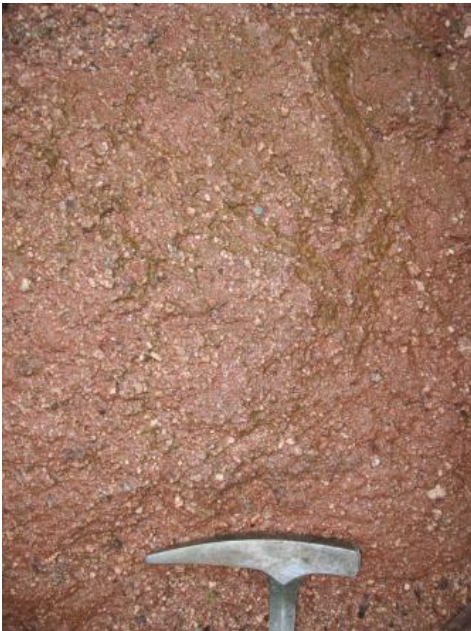
Arkose der Zechstein-Randfazies am Merkur bei Baden-Baden