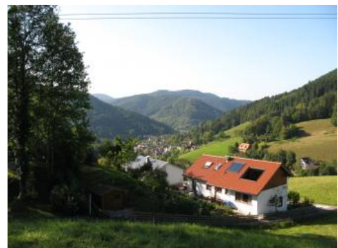
Schiltachtal bei Schramberg

Die größte Mächtigkeit von Rotliegend-Sedimenten wurde in der Michelbach-Formation von der Thermalbohrung Waldbronn II mit etwa 1500 m erschlossen, bei deren untersten 500 m es sich allerdings möglicherweise um Tuffe der Rotliegend-Magmatite handelt. Die Basis des Rotliegend wurde hier nicht erreicht. Auch aus der Weitenau-Formation sind Mächtigkeiten von über 800 m bekannt. Nahe der Beckenränder reduziert sich die Mächtigkeit rasch auf unter 300 m, in den kleineren Vorkommen sind es oft weniger als 100 m.