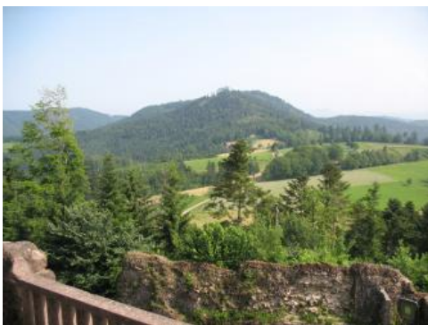
Rauhkasten bei Seelbach

Rotliegend-Magmatite finden sich in Baden-Württemberg an verschiedenen Stellen im Odenwald sowie im Nord- und Zentralschwarzwald an der Erdoberfläche. Weitere Vorkommen sind aus Tiefbohrungen im östlich angrenzenden Schichtstufenland und aus Oberschwaben bekannt. Besonders die subvulkanischen Stöcke, Laven und Ignimbrite bilden oft steil aufragende Härtlinge, auf denen nicht selten im Mittelalter Burgen erreicht wurden (Wachenberg im Odenwald, Yburg oder Hohengeroldseck im Schwarzwald). Die größte Verbreitung zeigen die Vulkanite nördlich von Heidelberg (Raum Dossenheim–Schriesheim), im Nordschwarzwald (südlich Baden-Baden) sowie östlich und südöstlich von Offenburg. Kleinere, landschaftlich weniger auffällige Vorkommen von Tuffen und anderen Vulkaniten liegen z. B. im Rotmurgtal und an der oberen Kinzig (Alpirsbach) sowie im Kesselberggebiet südöstlich von Triberg.