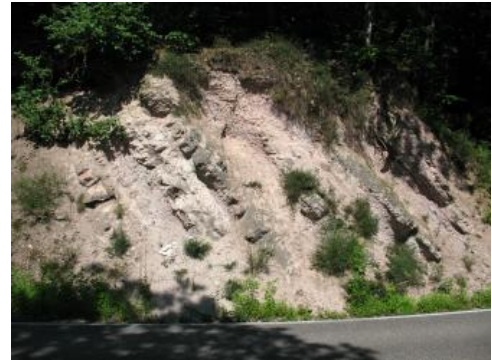
Tuffitische Sandsteine des Rotliegend bei Baden-Baden-Lichtental

Radiosotopische Datierungen an Rotliegend-Magmatiten wurden bisher fast nur mit der Rb-Sr-Methode durchgeführt und ergaben meist Alter zwischen 290 und 299 Mio. Jahre (Literatur s. Nitsch & Zedler, 2009; Seckendorff, 2012). Dies entspricht einem Alter am Beginn des Perms, zwischen der Karbon-Perm-Grenze und dem Sakmarium und ihrer mittleren Altersstellung zwischen den Ablagerungen des Oberkarbon (mit Pflanzenfossilien des Stefan bzw. Kasimovium–Gzhelium) und den Rotliegend-Sedimenten (mit Fossilien aus dem jüngeren Unterperm). Der einzige Fossilfund aus Zwischensedimenten der Rotliegend-Vulkanite, ein Pflanzenrest von Autunia conferta , erlaubt keine genauere Einstufung, da die Art vom ausgehenden Karbon bis ins Perm über einen langen Zeitraum existierte.