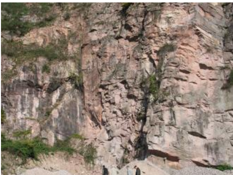
Quarzporphyr (Rhyolith), Rotliegend, Baden-Baden

Die größten Mächtigkeiten erreichen, gemessen als Profilabfolge von Pyroklastika, Zwischensedimenten und Laven, die Lichtental-Formation mit über 900 m und, gemessen als Schlotdurchmesser, der Wachenberg-Quarzporphyr der Schriesheim-Formation mit etwa 1 km. Auch in den übrigen Vorkommen sind Schlotdurchmesser und Profilabfolgen von mehreren hundert Metern belegt, einzelne Lavadecken können Mächtigkeiten von über 100 m erreichen. Andere Vorkommen beschränken sich dagegen auf wenige Meter mächtige Tuffablagerungen.