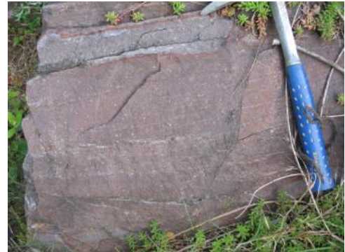
Quarzporphyr des Rotliegend, Hohengeroldseck

Bei den Rotliegend-Magmatiten des Oden- und Schwarzwalds handelt es sich durchgehend um primär rhyolithische Gesteine, deren heutige Zusammensetzung jedoch durch hydrothermale Überprägungen und permzeitliche Verwitterung teilweise deutlich verändert wurde (Nitsch & Zedler, 2009; Seckendorff, 2012). Die Veränderung umfassen je nach Gestein Verkieselungen, Serizitisierung von Feldspäten, Mineralneubildungen, Bleichung, Oxidation mit Hämatitabscheidung und tonige Verwitterung von glasigen Anteilen (insbesondere der Tuffe).