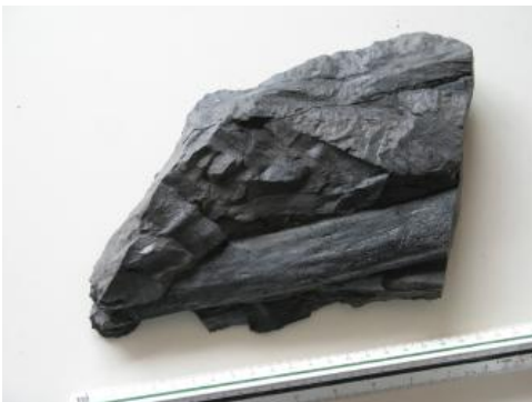
Pflanzenreste im Oberkarbon von Berghaupten

In den kohleführenden Sedimenten von Diersburg-Berghaupten (Berghaupten-Formation) wurden Pflanzenreste gefunden, die diese Schichten in das ausgehende Namurium oder frühe Westfalium datieren (Bashkirium der internationalen Gliederung). Dagegen fanden sich in den tieferen Schichten von Staufenberg- und Hohengeroldseck-Formation Pflanzenfossilien aus dem tieferen Stefanium (Kasimovium bis Gzhelium der internationalen Gliederung), in der Oppenau-Formation zudem wenige Palynomorphe, die einen Ablagerungszeitraum bis nahe an die Karbon-Perm-Grenze nahelegen. Lediglich die wenigen und verstreuten Reliktvorkommen der Sankt-Peter-Formation (Breisgau-Becken) sind bislang nicht datiert, entsprechen allerdings in Ausbildung und Lagerung eher den jüngeren Becken des übrigen Schwarzwaldes.