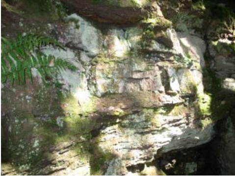
Arkosen des Oberkarbons bei Oppenau-Lierbach

Es handelt sich überwiegend um alluviale bis fluviale grobe und feinkörnige Arkosen mit örtlich unterschiedlicher Geröllführung und Zwischenlagen aus schluffigen, seltener tonigen Sedimenten und örtlichen Kohleflözen (heute meist abgebaut). In mehreren Vorkommen sind saure, oft verwittert überlieferte Tuffe und Tuffite eingeschaltet. Die Gesteinsfarben sind überwiegend grau bis grauviolett, doch treten im höheren Teil zunehmend rotbraune Einschaltungen auf.