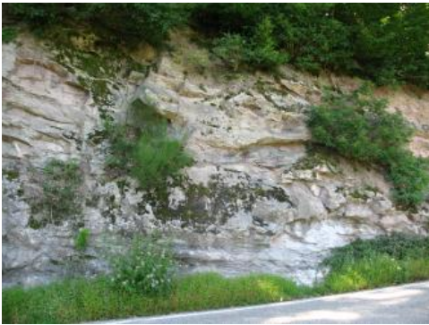
Arkosen des Oberkarbons bei Baden-Baden-Müllenbach