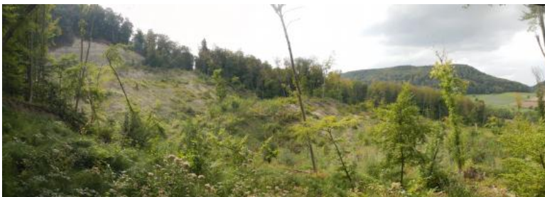
Rutschung in Talheim bei Mössingen am Albrauf

Rutschungen sind hangabwärts gerichtete gleitende Bewegungen von Fest- und/oder Lockergesteinen. Sie entstehen an definierten Gleitflächen, wobei je nach Form der Gleitfläche zwischen Translationsrutschung und Rotationsrutschung unterschieden wird. Während der Bewegung auf einer Gleitfläche behält die Rutschmasse den Kontakt zur Unterlage weitgehend bei (AD-HOC-Arbeitsgruppe Geologie, 2016). Größe, Tiefe und Geschwindigkeit einer Rutschung können stark variieren.