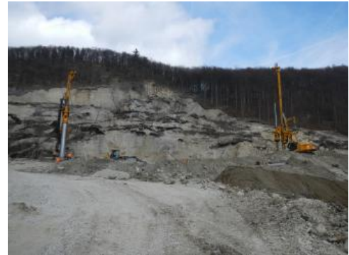
Erstellung einer „Sickergalerie“

Für eine dauerhafte Sicherung sind ein konsequentes Monitoring des Hangbereiches, der Entwässerungssysteme sowie deren Instandhaltung entscheidend.