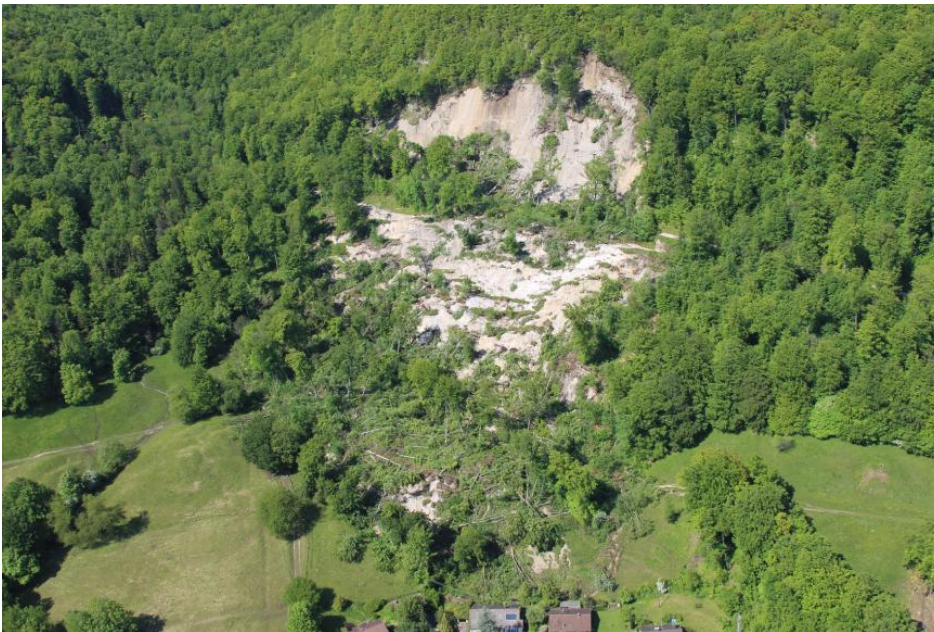
Bergrutsch Mössingen-Öschingen

Das Ereignis ist als Reaktivierung einer wahrscheinlich Jahrhunderte oder Jahrtausende alten Hangbewegung zu verstehen.