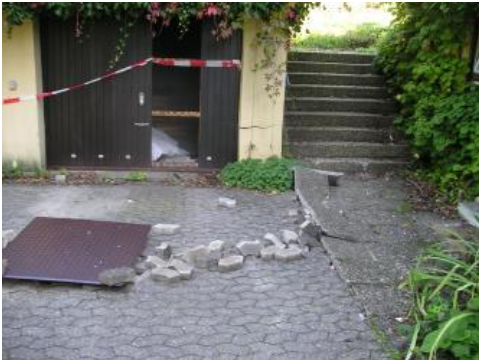
Schubrisse im Mauerwerk und Aufwölbungen im Verbundsteinpflaster

Die Gebäude der Landhaussiedlung waren nicht unmittelbar von den Rutschmassen betroffen. Die Rutschungszunge endet wenige Meter oberhalb der ersten Gebäude. Jedoch wurden die Gebäude mittelbar durch die talwärts gerichtete Druckausbreitung der im Hang oberhalb bewegten Boden- und Felsmassen und dadurch bedingte Untergrundverformungen betroffen und infolge dessen mehr oder minder stark beschädigt. Die Schäden zeigten sich in Form von Schubrisse im Mauerwerk sowie von Aufwölbungen in den Außenanlagen (z. B. Aufwölbung von Verbundsteinpflaster).