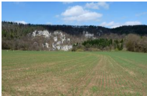
Pleistozäne Flussterrasse im Donautal bei Sigmaringen-Gutenstein

Der größte Teil der Terrassen im Randbereich des relativ breiten Donautals bei Tuttlingen wird von mächtigeren Kolluvien ( r10 ) oder von Schwemmschutt ( r32 , Rendzina) überdeckt. Nur an wenigen Stellen im Übergang zur Aue befindet sich der zum großen Teil aus Karbonatgesteinsschutt bestehende Terrassenkörper nahe der Oberfläche. Vorherrschende Böden sind Rendzinen und Braune Rendzinen ( r31 ). Auf zwei weiteren, südwestlich von Beuron und bei Inzigkofen wenige Meter über der Donau gelegenen Terrassen, treten ebenfalls Braune Rendzinen und Rendzinen als Leitböden auf ( r48 ). Der Oberboden ist dort meist in einer lösslehmhaltigen Deckschicht (Decklage) entwickelt. Ein Einzelvorkommen mit Terrae fuscae und Rendzinen aus Hangschutt über einer vermutlich rißzeitlichen Terrasse wurde an einem Unterhang im Aitrachtal bei Geisingen-Aulfingen