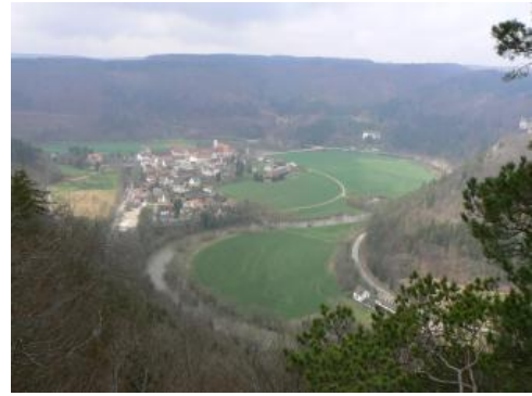
Blick auf Beuron von Südosten

Auf den tieferen, ca. 5–50 m über der Donauaue gelegenen pleistozänen Flussterrassen zwischen Immendingen und Sigmaringen nimmt KE r69 den größten Raum ein. Verbreitet treten tiefgründige, meist ackerbaulich genutzte Lehm Böden mit geringem bis mittlerem, im Unterboden z. T. hohem Kiesgehalt auf. Es handelt sich um Parabraunerden oder, bei schwächer ausgeprägter Tonverlagerung, um Parabraunerde-Braunerden, deren oberer Profilabschnitt meist in lösslehmreichen Fließerden entwickelt ist (Deck- und/oder Mittellage). Der tonverarmte Oberboden ist oft durch Bodenerosion stark verkürzt. Auf manchen Terrassenabschnitten sind die Böden von jungen, z. T. karbonathaltigen Abschwemmassen überdeckt (Kolluvium über Parabraunerde). Bei Tuttlingen wurden zwei Flächen abgegrenzt, an denen solche über Parabraunerden oder Braunerden liegenden Kolluvien dominieren ( r18 ). Zwischen den holozänen Abschwemmassen und den Terrassenschottern liegt dort oft noch eine dünne Lage eines tonig-lehmigen Hochflutlehms.