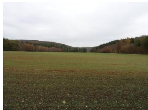
Talsohle am Ausgang des Wasserburger Tals zwischen Engen und Aach

Die am Ausgang des Wasserburger Tals südöstlich von Engen in KE r100 abgegrenzten Rendzinen bilden keine morphologische Terrasse, sondern eine breite ackerbaulich genutzte Aufschüttungsebene aus periglazialen Kies und Schwemmschutt. Örtlich kann auch eine weitere Bodenentwicklung zur Braunerde-Terra fusca erfolgt sein. Im Übergang zu den angrenzenden Hängen treten stellenweise Kolluvien auf.