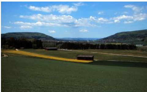
Blick nach Westen durch die Blumberger Pforte zum Südschwarzwald

Die obermiozänen-pliozänen Höhenschotter der Urdonau sind als Beimengung in den Böden der Albhochfläche entlang der Donau immer wieder anzutreffen. Es handelt sich aber meist nur um eine lockere Kiestreu von Restschottern mit Quarzen, Quarziten und quarzitischen Sandsteinen. Nur in wenigen kleineren Gebieten, wo die kieseligen Schotter bestimmend für die Skelettfraction der Böden sind und wo auch Kiesverwitterungslehm auftritt, wurden bodenkundliche Kartiereinheiten ausgewiesen. Bei dem Vorkommen auf dem Eichberg bei Blumberg handelt es sich um kiesige Lehmböden, in denen eine Lessivierung abgelaufen ist und die deutliche Anzeichen zeitweiliger Staunässe aufweisen ( r21 , Pseudogley-Parabraunerde, Parabraunerde-Pseudogley). Etwa 35–40 km weiter nordöstlich und