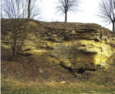
Obere Meeresmolasse (tOM): Sandgrube bei Rammingen/Alb-Donau-Kreis

Die Steinhöfe-Formation besteht aus Sandsteinen, Mergelsteinen und Krustenkalken, die eine zunehmend terrestrische Entwicklung mit Bodenbildung (Albstein, tA) anzeigen.