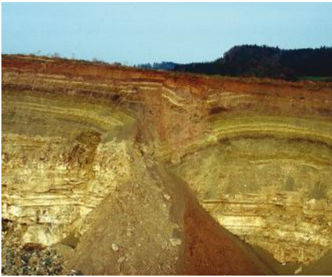
Grabfeld-Formation (kmGr, früher: Gipskeuper) mit Doline: Steinbruch westlich von Gaildorf-Eutendorf