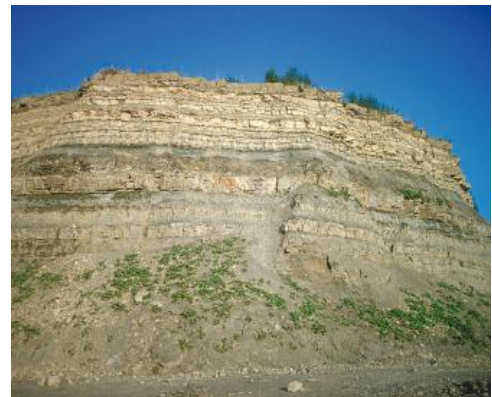
Erfurt-Formation (kuE, früher: Lettenkeuper): Steinbruch Wilhelmglück

Die Erfurt-Formation (kuE, früher: Lettenkeuper) des Unterkeupers und die Grabfeld-Formation (kmGr, früher: Gipskeuper) des unteren Mittelkeupers bestehen aus einer Wechsellagerung von Tonsteinen, Karbonatsteinen, Sandsteinen und Sulfatgesteinen. Die Erfurt-Formation setzt sich aus Dolomitsteinen (Basisschichte, Albertibank, Anthrakonitbank, Anoplophoradolomit, Linguladolomit, Grenzdolomit), Ton- und Schluffsteinen sowie feinkörnige Quarzsandsteinen (Hauptsandstein, Anoplophorasandstein, Lingulasandstein) zusammen. Lokal sind in den Sandsteinen kleine Flöze aus inkohlten Pflanzenresten (Lettenkohle) verbreitet. Im unteren Profilabschnitt finden sich Kalksteinbänke (z. B. Grenzbonebed). Im mittleren und höheren Teil treten vereinzelt Gipslagen und -linsen (z. B. Böhringen-Sulfat) auf.