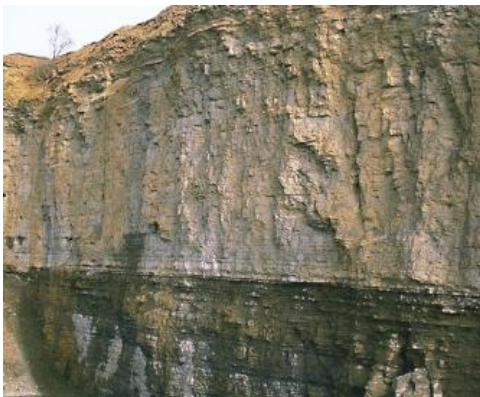
Jena-Formation (muJ, früher: Wellenkalk-Formation): Steinbruch und Schotterwerk nordöstlich von Laibach

Der Untere Muschelkalk besteht aus Kalksteinen, Mergelsteinen, Tonmergelsteinen und Dolomitstein. Die Kalkfazies des Beckeninneren (Jena-Formation) wird in Annäherung an den Beckenrand nach Süden zunehmend durch eine mergelige Dolomitfazies (Freudenstadt-Formation) ersetzt (Geyer et al., 2011). Zum Rand der Verbreitung nach Osten und Südosten hin werden die von Molassesedimenten überlagerten Gesteine des Unteren Muschelkalks zunehmend sandig.