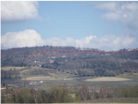
Übersichtsfoto des Bereichs der Rutschung Heiligenberg mit Hauptanriss (rot gestrichelt) und sichtbarem Rutschungsumriss (schwarz gestrichelt), Blick von Frickingen Richtung Heiligenberg