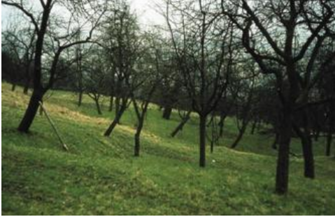
Geländeverformungen im Ausstrichbereich der Gesteine der Trossingen-Formation nahe Birenbach bei Göppingen (Foto: Abbildung 17 aus LGRB-Informationen 16, 2005)

Wie bei allen Rutschungen spielen auch in den Gesteinen der Trossingen-Formation Veränderungen des bestehenden Kräftegleichgewichts die maßgebliche Rolle.