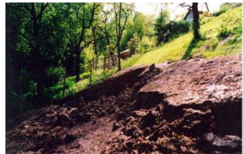
Rutschung in Stuttgart-Vaihingen

In den typischen braunroten bis braunviolettenschluffigen Tongesteinen sind grünlichgraue, teils rote oder gelbliche (namensgebende) Kalkstein- oder Dolomitsteinknollen eingelagert. Ein vergleichsweise hoher Anteil an quellfähigen Tonmineralen (der Montmorillonit-Gruppe) verleiht den als „veränderlich fest“ zu charakterisierenden, nahezu schichtungslosen Tongesteinen insbesondere bei Wasserzutritt ungünstige Baugrundeigenschaften und in Hanglagen eine ausgesprochene Neigung zu Instabilitäten.