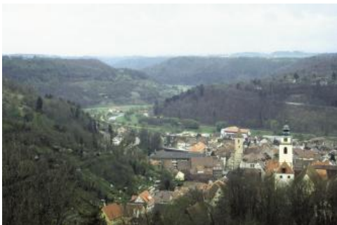
Blick nach Osten, über die Altstadt von Horb am Neckar, auf die Talschlingen des oberen Neckars

In den Gäulandschaften sind entlang der Talhänge zahlreiche großflächige Rotationsrutschungen im Übergangsbereich vom Mittleren zum Oberen Muschelkalk vorzufinden. Besonders weit verbreitet sind Rutschungen an den Hängen des Neckartals. Auch an den Talhängen der Neckar-Nebenflüsse Jagst und Kocher sind Rutschungen häufig zu beobachten und prägen das Landschaftsbild.