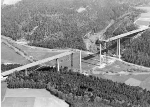
Luftbild der im Bau befindlichen Neckarbrücke Weitingen (Horb) im Mai 1978

Zahlreiche Beispiele für großräumige Rutschungen im Grenzbereich des Mittleren zum Oberen Muschelkalk sind in Baden-Württemberg bekannt. Im Zuge des Autobahnbaus A 81 zwischen Stuttgart und Singen wurden im Bereich zwischen den Anschlussstellen AS Rottenburg und AS Villingen-Schwenningen drei große Talbrücken geplant, welche zweimal über das Neckartal und einmal über das Eschachtal führen. Im Zuge der Planung und Ausführung dieser Brücken wurden in den Hangbereichen zahlreiche großflächige Rutschungen festgestellt. Im Fall der Neckarbrücke Weitingen führte dies zu einem technisch aufwändigen Bauwerk unter Verzicht von Pfeilergründungen im gesamten südlichen Hang. Hier musste der Hang z. B. durch nur ein einzelnes Brückenfeld von 263 m überspannt werden.