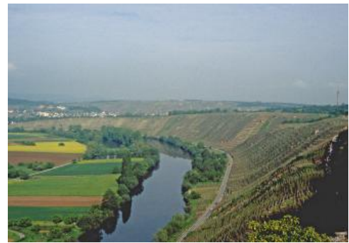
Das Neckartal nordwestlich von Hessigheim

Auch im Bereich des Wurmbergwegs und den darüber liegenden, weit bekannten Felsengärten bei Hessigheim führt die Gipsauslaugung im Mittleren Muschelkalk sowohl zu Hangbewegungen in den mit Hangschutt überlagerten Hängen sowie auch immer wieder zu Felsstürzen aus den Hangkanten des überlagernden Oberen Muschelkalks.