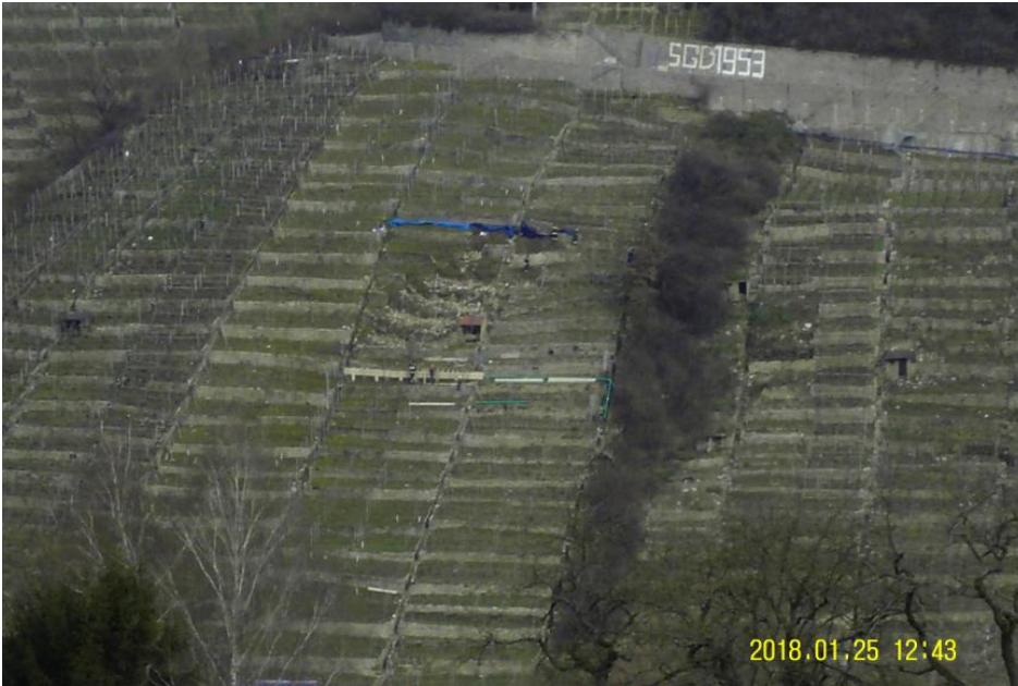
Rutschung 2018 unterhalb des Wurmbergweges

Die Rutschung wies im Januar 2018 eine Länge von 16 m und eine Breite von 20 m auf. Es rutschten insgesamt sechs Terrassen mit den sich darauf befindenden Trockenmauern ab. Innerhalb der Rutschung waren drei Abrisskanten vorhanden, welche jeweils 50–80 cm Versatz aufwiesen. Seitlich angrenzend an die Rutschung waren Zerrspalten im Boden zu erkennen, die auf eine potenzielle Verbreiterung der Rutschungsfläche hindeuteten.