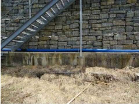
Aufgehende Spalte am Fuß der talseitigen, rückverankerten Stützmauer (Aufnahme 2020)

Bei dem in der Abbildung dargestellten diagonal verlaufenden Riss in der Fahrbahn ist anzumerken, dass sich dieser im Bereich der Anfang der 70er Jahre beschriebenen diagonal verlaufenden Stufe befindet. Es ist also anzunehmen, dass der Riss nicht nur im Übergang des rückverankerten zum nicht rückverankerten Teil der Mauer begründet ist. Womöglich befindet sich hier eine den Hang und den Wirtschaftsweg schneidende Hangzerreißung innerhalb des Muschelkalks, wie bereits 1972 vermutet wurde.