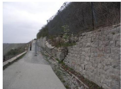
Eingestürzte bergseitige Stützmauer (Aufnahme 2007)

In den Folgejahren und -jahrzehnten traten immer wieder Senkungen in der Fahrbahn des Wurmbergweges sowie Schäden an den tal- und bergseitigen Stützmauern auf. 2007 stürzte schließlich ein Teil der bergseitigen Stützmauer auf den Wurmbergweg. Etwas weiter westlich war der Hangschutt am Fuß der talseitigen Stützmauer aus Gabionen abgerutscht, sodass die Gabionen teilweise stark unterhöhlt waren und sich stark verformten. Die talwärts gerichtete Verformung der Gabionen führte in diesem Abschnitt zu einer großen Senkung des Wurmbergweges. Klaffende Risse in der Fahrbahn waren die Folge.