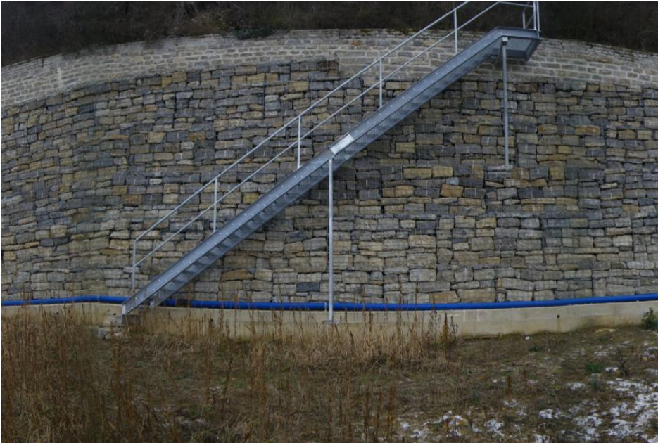
Talseitige Stützmauer des Wurmbergweges nach der Sanierung 2009

Da die Verkehrssicherheit in diesem besonders stark betroffenen Abschnitt im Westen des Wurmbergweges nicht mehr gegeben war, wurde dieser 2008/2009 schließlich aufwändig saniert. Um Bewegungen der talseitigen Stützmauer aufgrund des unterhalb gelegenen kriechenden Hanges zu minimieren, wurde die Mauer in dem Abschnitt der früheren Gabionen bis in den rückwärtig anstehenden Kalkstein rückverankert und auf einer Stahlbetonkonstruktion gegründet. Seit Fertigstellung der Sanierung werden der Wurmbergweg, die Stützmauern sowie der darunterliegende Hang mittels gesetzter Messpunkte regelmäßig geodätisch vermessen.