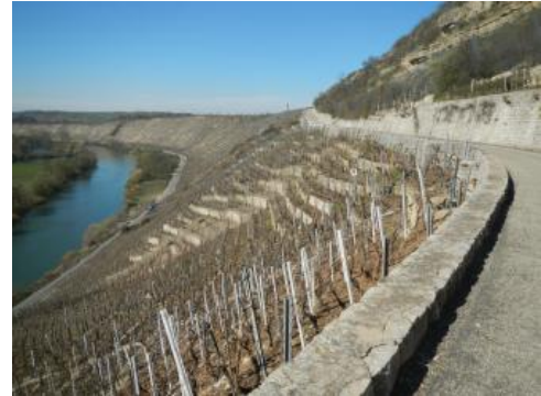
Blick auf den Wurmbergweg

Im Bereich der Rebhänge am Neckar nordwestlich der Ortschaft Hessigheim befindet sich der Wurmbergweg, der als Wirtschaftsweg vor allen Dingen der Bewirtschaftung der steilen Reblagen am Neckar dient. Daneben wird der Weg von zahlreichen Touristen als Fahrrad- und Fußweg genutzt. Nachdem der Weg in den 50er Jahren geplant und gebaut worden war, kam es bereits kurze Zeit später zu ersten Schäden an dem Weg und seinen Stützmauern. Dies ist auf die am Wurmberg auftretenden Hangbewegungen zurückzuführen, welche durch die im Untergrund ablaufenden Auslaugungsvorgänge in den gipsführenden Schichten des Mittleren Muschelkalks induziert werden.