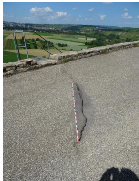
Riss innerhalb des Wurmbergweges (Aufnahme 2020)

Nach der Sanierung eines Teilstücks des Wurmbergweges im Jahr 2009 kam es bereits wenige Jahre später zu Schäden am Übergang zum unsanierten Fahrbahnbereich des Wurmbergweges. Während der sanierte, rückverankerte Abschnitt des Wurmbergweges relativ lagestabil ist, bewegt sich der südöstlich angrenzende, nicht rückverankerte Bereich weiterhin talwärts. Risse am Übergang des rückverankerten zum nicht rückverankerten Bereich, sowohl in der talseitigen Stützmauer, als auch in der Fahrbahn waren und sind auch weiterhin die Folge. Regelmäßig durchgeführte tachymetrische Höhenmessungen an den Stützmauern, in der Fahrbahn und im Hang unterhalb des Wurmbergweges bestätigen diese Beobachtungen.