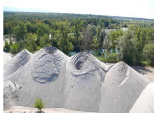
Aus den quartären Kieslagern des Oberrheingrabens durch Aufbereitung abgetrennte Fein- bis Grobsande.