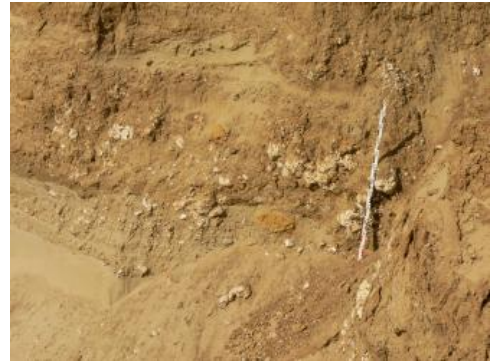
Karbonatisch verfestigte Sandsteinlagen und Kalkkonkretionen.

Die Grobsandfazies besteht überwiegend aus fein- und grobsandigen, schwach schluffigen Mittelsanden , welche schwach fein- bis mittelkiesig sind. Der Kiesanteil liegt zwischen 2,5–5 %. Der Ton- und Schluffgehalt beträgt etwa 2 %. Teilweise kommen reine Grobsande vor. Kennzeichnend sind die Glaukonitführung und die oft ausgeprägte Schrägschichtung . Neben karbonatfreien Partien ist der überwiegende Teil der Sande karbonatisch. Gelegentlich sind diese zu karbonatisch zementierten Sandsteinen verfestigt. Vor allem im unteren Abschnitt sind die Grobsande feinkiesig und häufig reich an Molluskenschalen, zum Teil liegen regelrechte Schillsande vor. Die Sande haben eine hellgelbliche sowie hell- bis mittelbraune Farbe. Neben den karbonatisch verfestigten Lagen treten, abgesehen von Karbonatanreicherungen, vereinzelt Karbonatknollen auf. Insgesamt weist der Grobsandzug eine lithologisch recht inhomogene Zusammensetzung auf.