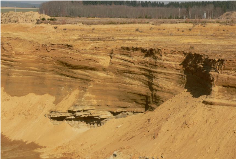
Abbauwand des Grobsandzugs mit Schrägschichtung