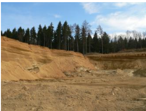
Abbauwand aus Sanden mit Schräg- und Horizontalschichtung.

Der Grobsandzug der Oberen Meeresmolasse ist ein schmaler und langgestreckter, küstenparallel verlaufender Sedimentationskörper des Molassemeeres . Er ist teilweise gut als Höhenzug erkennbar und lässt sich von Friedingen (NO Singen) über die Nellenburg (W Stockach) – Zizenhausen (N Stockach) – Mindersdorf – Rast – Walbertsweiler – Rengetsweiler – Hausen am Andelsbach bis Rosna (S Mengen) verfolgen. Die Abgrenzung der wirtschaftlich interessanten Bereiche erfolgt durch die nutzbare Mächtigkeit, die Überlagerungsmächtigkeit nicht verwertbarer Schichten sowie durch die Verzahnung mit Sandschiefer, Muschelsandstein und Grobsandsteinen an den Rändern und im Liegenden.