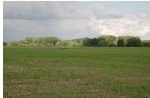
Ältere Auenterrasse im Donautal bei Altheim

Die höher liegenden Auenbereiche im Donautal, die von der jüngsten Aue verbreitet durch eine mehrere Dezimeter bis teilweise über 1 m hohe Stufe abgesetzt sind, wurden dagegen in jüngerer Zeit nur noch durch einzelne Hochwässer erreicht. In Abhängigkeit von den ehem. Grundwasserständen sind hier auf kalkhaltigen bis -reichen Hochwasserabsätzen Braune Auenböden und Auengley-Braune Auenböden ( t325 ), Auengley-Braune Auenböden und Braune Auenböden-Auengleye ( t326 , t328 ) sowie die Kartiereinheiten t327 (Brauner Auenboden-Auengley und Auengley) und t328 (Auengley) verbreitet. Im Randbereich der Donauaue, im Übergang zum Kalktuffvorkommen von Riedlingen-Altheim, findet sich Kartiereinheit t331 mit Auengley aus geringmächtigem Auenlehm über fluviatil umgelagertem Kalktuffmaterial. In die Substratabfolge können dabei Torflagen an unterschiedlichen Stellen eingeschaltet sein.