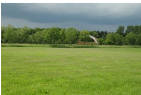
Zum Hochwasserschutz in der Aue bei Neufra erstellte Deichanlagen entlang der Donau

Die jüngsten Auenbereiche bilden entlang des heutigen Donaulaufs einen ca. 0,5–1 km breiten Streifen. In diesem pendelte die Donau vor den in der 2. Hälfte des 19. Jh. erfolgten Flussbegradigungen und ersten Eindeichungen in größeren Mäandern und verlagerte dabei immer wieder ihren Lauf. Diese junge, aktive Formung durch den Fluss kommt auch in dem hier häufig verbreiteten unruhigen, flachwelligen bis -kuppigen Kleinrelief zum Ausdruck. Mehrfach im Jahr dürfte die Donau über die Ufer getreten sein und das tiefste Niveau komplett überschwemmt haben. Typisch für diese jüngsten Auenbereiche sind kalkreiche Braune Auenböden (Vegen) aus kieshaltigem Auenlehm und -sand ( t80 ). Die mit 3–7 dm verhältnismäßig geringe Mächtigkeit der Auensedimente und ihre vergleichsweise grobe Ausbildung sprechen für eine höhere Strömungsgeschwindigkeit der Hochwässer, die auch zu