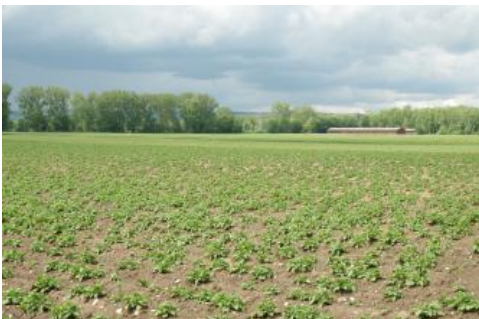
Ältere Auenbereiche im Donautal bei Neufra

Ab Mengen und von dort am östlichen Rand des Donautals nach Norden treten zunächst ausgedehnte kiesige Niederterrassenflächen auf, die sich bis Riedlingen zunehmend auflösen. Aufgrund der früher sehr hohen Grundwasserstände dominieren hier reliktsche Niedermoore ( t113 ) und Anmoorgleye ( t105 ), wie sie auch für die größeren Täler des übrigen Altmoränengebiets charakteristisch sind. Bis zum jungen Hochwasserbett der Donau schließen an diese Niederterrassenflächen jüngere fluviatile Bereiche an, die uneinheitliche und teilweise unübersichtliche bodengeographische Verhältnisse aufweisen. Höher gelegene Terrassenniveaus wurden nur teilweise von jungen Hochwässern erreicht, weshalb mächtigere homogene Auenlehmdecken hier abschnittsweise fehlen. Andererseits haben aus dem Altmoränenhügelland einmündende größere und kleinere Fließgewässer ihre jungen Hochwasserabsätze örtlich auf den Terrassenflächen hinterlassen. Als zusätzlich variierender Faktor macht sich der randlich ursprünglich hohe, jedoch zur Donau hin absinkende Grundwasserspiegel bemerkbar. Durch die fortschreitende Einschneidung der Donau und durch großflächige Entwässerungsmaßnahmen sind viele Böden aktuell ohne Grundwassereinfluss und ihre Gleymerkmale mithin reliktscher Natur.