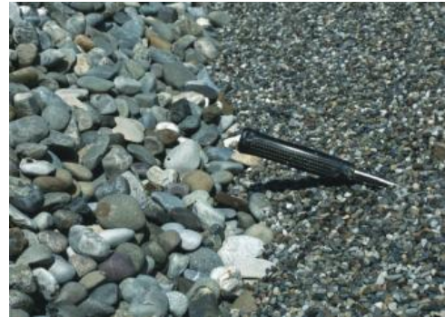
Klassierung in Feinkies und Grobkies

Gewinnung: Die Gewinnungstechnik richtet sich nach der Festigkeit, der Mächtigkeit und der Grundwasserführung der Kiesablagerungen. Im Oberrheingraben herrscht aufgrund des meist geringen Grundwasserflurabstands Nassbaggerung mit großen schwimmenden Greifer- oder Saugbaggern vor, die Tiefen von 80 m und mehr erreichen können. Über schwimmende Bandanlagen sind diese mit dem Kieswerk verbunden. Im Alpenvorland erfolgt Trockenabbau mit Baggern und Radladern, in nagelfluhreichen Vorkommen wird bisweilen auch Sprengtechnik eingesetzt. Eimerkettenbagger sind allgemein nur noch selten in Nutzung. Bei allen größeren Kiesgruben ist die Aufbereitung (Vorabsiebung, Waschen, Klassierung, Splitterzeugung usw.) unmittelbar angeschlossen; Kiese und Sande aus kleinen Abbauen in geringmächtigen Vorkommen werden meist in