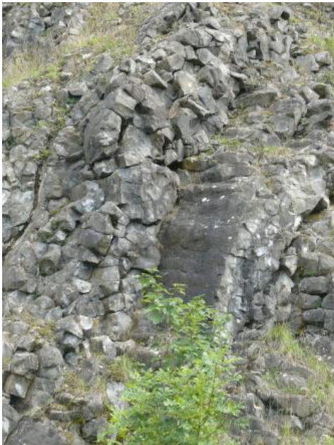
Basaltsäulen in Meilerstellung

1) Quarzporphyre (Rhyolithe) treten als massige, dichte, meist gelbbraune, hell- bis dunkelviolette, rotviolette bis blaugraue, aber auch rötliche und grünliche Gesteine auf. Im frischen Zustand zeigt das Gestein einen scharfkantigen, splittrigen, unregelmäßigen bis muscheligen Bruch. Im angewitterten Zustand besitzt es eine hellbraune bis gelbliche Farbe. Säulige Absonderungen sind häufig. Quarzporphyre bestehen i. d. R. aus einer sehr feinkörnigen, gut verzahnten Grundmasse aus Quarz, Feldspäten und Glimmer, in der größere Kristalle von Quarz und von Feldspat schwimmen (= porphyrisches Gefüge).