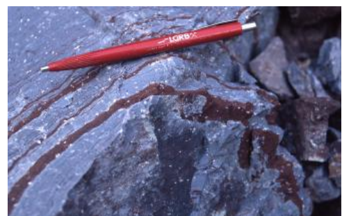
Brandeck-Quarzporphyr mit der typisch violettgrauen Farbe und den charakteristischen Einsprenglingen

1) Quarzporphyre sind alte, fast überall hydrothermal überprägte Rhyolithe. Entlang des Westrands des Odenwalds sowie des Schwarzwalds sind an verschiedenen Stellen die vulkanischen Gesteine des Permokarbons vorhanden. Die Dehnung der Kruste im Oberkarbon und Unterperm (Rotliegend) führte zur Bildung von tektonischen Gräben und Horsten. Im Rotliegenden setzte ein explosiver Vulkanismus ein. Dabei entstanden Schlot- und Spaltenfüllungen sowie mächtige deckenartige Laven, Pyroklastika (Tuffe) und Ignimbrite (Glutwolkenablagerungen), die als „Quarzporphyre“ bezeichnet werden.