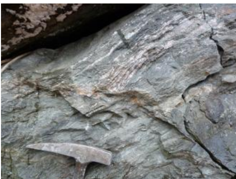
Randgranit mit deutlicher Regelung

Die Plutonite bilden aus magmatischen Schmelzen entstandene, sehr große, massige, unregelmäßig geformte, tief reichende Körper (im Schwarzwald vermutlich noch ca. 4–8 km). Die durch geologische Kartierung nachgewiesene flächenhafte Ausdehnung beträgt oft zwischen 50 und etwas über 100 km 2 , der Triberg-Granit im Mittleren Schwarzwald hat eine noch größere Ausstrichfläche von ca. 250 km 2 . Nutzbare Partien weisen in Bezug auf ihre Lithologie und die sich daraus ergebenden Materialeigenschaften einen einheitlichen Aufbau auf.