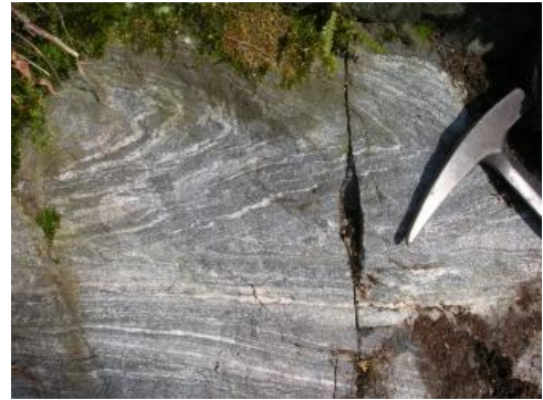
Gefalteter Amphibolit aus dem Steinbruch Waldkirch

Genutzte Mächtigkeit: Zurzeit werden in elf Steinbrüchen Gneise und Anatexite sowie in einem Steinbruch Metagrauwacken und Metapelite gebrochen. Die genutzte Mächtigkeit variiert zwischen 15–135 m.