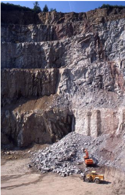
Über 100 m hohe Abbauwand im Flasergneis