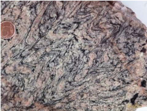
Stark gefalteter Gneis aus dem Steinbruch Gengenbach

Die metamorphen Gesteine sind, je nach Ausgangsgestein sowie den bei der Metamorphose herrschenden Druck- und Temperaturbedingungen, sehr variabel ausgebildet. Je nach Metamorphosegrad kann es zur Ausbildung einer Schieferung bzw. Foliation, Mineralneubildungen mit Einregelungen in die Foliationsebenen bis zur partiellen oder vollständigen Aufschmelzung der Gesteine kommen.