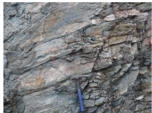
Biotitreicher Paragneis aus dem Steinbruch Freiamt-Keppenbach

Metamorphe Gesteine sind das Ergebnis einer Gesteinsumwandlung (Metamorphose) unter erhöhten Druck- und Temperaturbedingungen in der Erdkruste, die von einer Umkristallisation des Mineralbestandes über Mineralneubildung bis zur vollständigen Aufschmelzung der Ausgangsgesteine reicht. Metamorphe Gesteine bilden zusammen mit den Magmatiten das Grundgebirge und sind in Baden-Württemberg im Schwarzwald und südlichen Odenwald aufgeschlossen. Der Lagerstättenkörper der metamorphen Gesteine ist ein massiger, kristalliner, ungeschichteter Gesteinskörper, der stellenweise mit magmatischen Gesteinen durchsetzt ist. Im Schwarzwald werden die hochmetamorphen Gesteine dem Gneis-Migmatit-Komplex sowie die geringer metamorph überprägten Gesteine den Alten Schiefen zugeordnet.