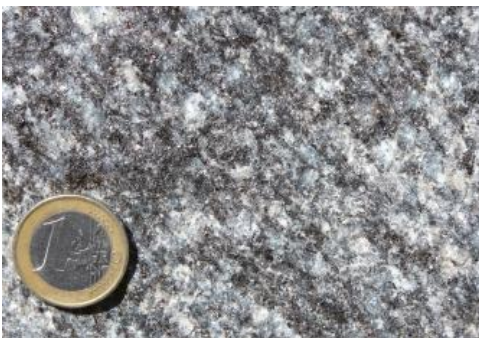
Cordieritgneis der Murgtal-Gneisanatexit-Formation aus dem Steinbruch Detzeln

Die metamorphen Gesteine sind, je nach Ausgangsgestein sowie den bei der Metamorphose herrschenden Druck- und Temperaturbedingungen, sehr variabel ausgebildet. Je nach Metamorphosegrad kann es zur Ausbildung einer Schieferung bzw. Foliation, Mineralneubildungen mit Einregelungen in die Foliationsebenen bis zur partiellen oder vollständigen Aufschmelzung der Gesteine kommen.