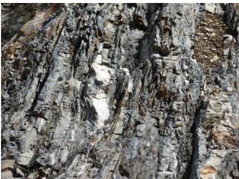
Wechselfolge aus Metagrauwacken und Metapeliten mit sigmoidalen Quarzlinsen

Zu den rohstoffwirtschaftlich genutzten Gesteinen zählen die Gneise und Anatexite, wie z. B. Ortho- oder Flasergneise, Paragneise, Gneisanatexite, Metatexite und Diatexite des Gneis-Migmatit-Komplexes sowie die Metagrauwacken und Metapelite der Badenweiler-Lenzkirch-Zone. Die Gneise und Anatexite des Schwarzwaldes weisen ein variables Erscheinungsbild auf, wobei ihre Grundzusammensetzung im Allgemeinen recht einheitlich ist. Ihre Hauptkomponenten sind Feldspat, Quarz und Biotit sowie geringe Anteile von Hornblende, Cordierit und Sillimanit.