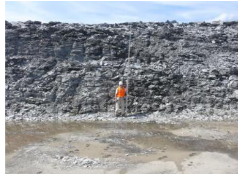
Abbauwand im Tagebau bei Dormettingen

Die Bezeichnung „Ölschiefer“ geht auf den oftmals hohen Kohlenwasserstoffgehalt zurück. Von rohstoffwirtschaftlicher Bedeutung ist der Posidonienschiefer heute besonders dort, wo er unverwittert ist, mindestens 5 m nutzbare Mächtigkeit und hohe Kohlenwasserstoffgehalte aufweist. Früher wurde der Posidonienschiefer wegen der Kohlenwasserstoffgehalte auch in Baden-Württemberg zu den Energierohstoffen gezählt, obgleich er heute überwiegend zur Portlandzement -Herstellung verwendet wird. Die Ölschiefer streichen entlang der Schwäbischen Alb aus und bilden einen flächenhaft verbreiteten, geschichteten Rohstoffkörper.