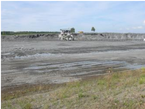
Abbau von Posidonienschiefer

Gewinnung: Bei größeren Ölschiefervorkommen außerhalb Baden-Württembergs können aus tieferen Lagerstätten Erdöl und Erdgas durch Sonden gefördert werden. Befinden sich kohlenwasserstoffreiche Gesteine nahe der Erdoberfläche, so ist eine Gewinnung im Tagebau möglich; bekanntes Beispiel sind die Ölsande des kanadischen Athabasca-Beckens.