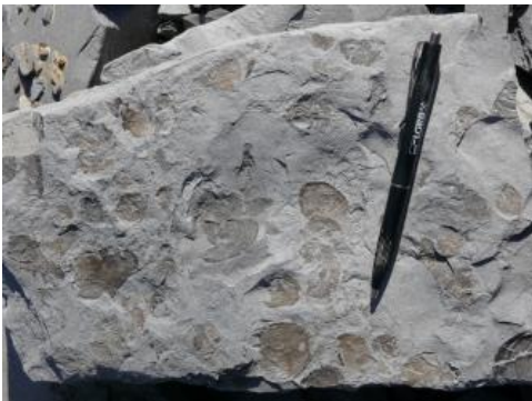
Muschel Bositra (früher Posidonia ) im Posidonienschiefer-Fleins

Die Gesteine der Posidonienschiefer-Formation, auch als „Ölschiefer“ bezeichnet, bestehen aus einem feinschichtigen Wechsel von Kalk-, Mergel-, Tonmergel- und Tonsteinen in fast schwarzen bis dunkelblaugrauen, teilweise gelbbraun gebänderten Tönungen mit hohen Anteilen an organischem Material. Eingeschaltet sind dunkelgraue Kalksteinbänke („ Fleins “). Pyrit tritt fein verteilt oder in Knollen auf. Das Gestein ist sehr fossilreich (Ammoniten, Muscheln, Belemniten, Seelilien, Fische, Ichthyosaurier u. v. m.).