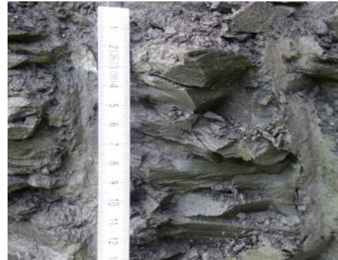
Bituminöse Mergelsteine im Steinbruch Ohmden

Genutzte Mächtigkeit: Bei Dotternhausen/Dormettingen werden 6–9 m genutzt bis zum Top des sogenannten „Fleins“ (Werksteinbank), da dieser eine tragfähige Sohlschicht für die schweren Fahrzeuge abgibt.