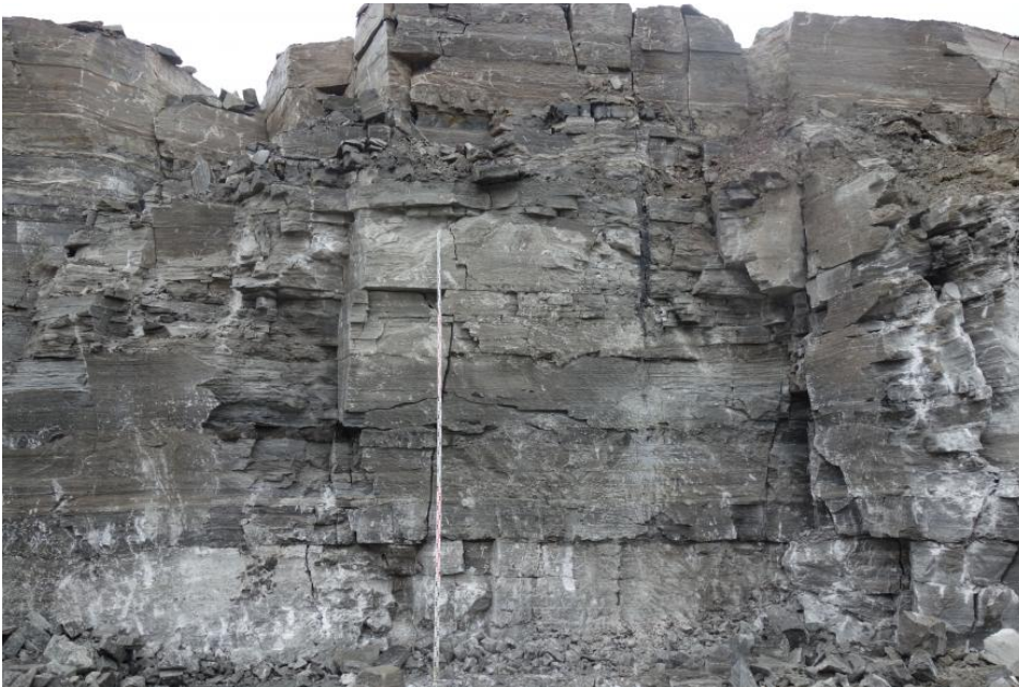
Abbauwand in den Grundgipsschichten

Nicht alle Gipsprodukte können aus REA-Gips in gleicher Qualität hergestellt werden. Bei der Produktion vieler Baugipsprodukte kommt REA-Gips zum Einsatz, bei der Herstellung von verschiedenen Spezialgipsen kann aber auf Naturgips derzeit nicht verzichtet werden. Bei der Verwendung von Naturgips ist für die Produktion die Gleichmäßigkeit einer definierten Zusammensetzung des Rohsteins sehr wichtig. Auch geringe Abweichungen führen zu veränderten Eigenschaften innerhalb einer Produktlinie. Aus diesem Grunde ist es für ein Gipswerk meist erforderlich, für die geforderte Rohstoffmischung mehrere Abbaustellen zu betreiben, um gleichmäßige Produkteigenschaften zuverlässig zu gewährleisten. Mächtigere Lagen von Anhydritstein bzw. Gips-Anhydrit-Mischgestein (sog. Anhydritmittel, ca. > 1 m; ggf. Abgabe an die Zementindustrie), Dolomitstein (> 50–70 cm) und Tonzwischenmittel werden beim Abbau nach Möglichkeit ausgehalten.