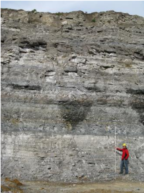
Profil im Steinbruch Oberndorf-Bochingen

Das Böhringen-Sulfat im oberen Teil des Unterkeupers ist nach den bisherigen Analysedaten vorwiegend als Gips-Anhydrit-Mischgestein ausgebildet (Einsatzbereich: Zementindustrie). Im Bereich von Störungen (höhere Wasserwegsamkeit) kann es bereichsweise voll vergipst sein. Auch vom unterlagernden Linguladolomit-Horizont her kann bei Grundwasserführung eine Vergipsung erfolgen.