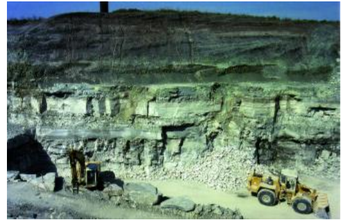
Abbau des Gipslayers der Grundgipsschichten

Gewinnung Gipsstein: Gips wird entweder aus natürlichem Gipsstein oder bei technischen Prozessen, zumeist aus der Entschwefelung von Rauchgasen von Kraftwerken (Gips aus Rauchgasentschwefelungsanlagen = REA-Gips), gewonnen. Derzeit beträgt der REA-Gips-Anteil am bundesweit eingesetzten jährlichen Gipsrohstoff ca. 55 %. Als Abschlussdatum für die Kohleverstromung in Deutschland empfiehlt die Kommission „Wachstum, Strukturwandel und Beschäftigung“ das Ende des Jahres 2038 (Kommission „Wachstum, Strukturwandel und Beschäftigung“, 2019). Um die Wertschöpfungsketten der Gipsindustrie zu erhalten, muss der fortschreitende und dann vollständige Wegfall an REA-Gips durch eine zusätzliche, umweltverträgliche Gewinnung von Naturgips ausgeglichen werden.