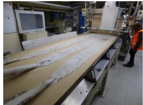
Produktion von Gipskartonplatten

Weiter werden Anhydrit- und Gipsestriche sowie Modell- und Formgipse erzeugt. Formgipse werden in der Keramikherstellung , in der Medizin (Zahnmedizin, Unfallmedizin) und im Kunst- und Handwerksbereich eingesetzt. Auch als Düngemittel und als Chemierohstoff wird Gips eingesetzt. Bei der Zementherstellung werden sowohl Anhydrit- als auch Gipssteine dem Klinker beim Mahlvorgang als Abbindeverzögerer beigegeben (4–5 Massen-%).