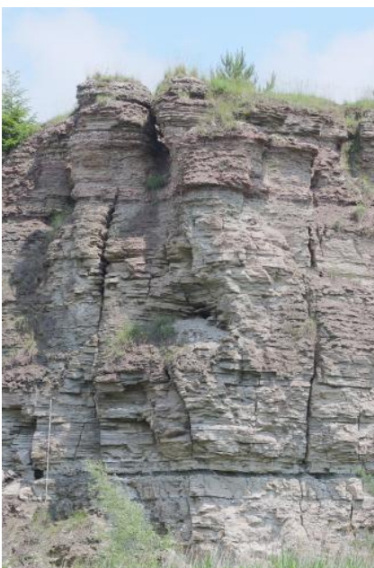
Felsengips (unten) und Plattengips (oben)

Während Gipsstein eher eine weiße bis braun-graue Farbe hat, erkennt man Anhydritstein an der oft weiß-grauen, auch bläulichen oder rötlichen Färbung. Kryptokristalliner Gipsstein wird als Alabaster bezeichnet. Weitgehend reine Gips- und Anhydritsteine lassen sich im Gelände mit einfachen Hilfsmitteln gut voneinander unterscheiden. Gipsstein ist weich und leicht (Mineral Gips: Mohshärte von 2, Dichte 2,3 \text{ g/cm}^3 ), während Anhydritstein deutlich härter und schwerer ist (Mineral Anhydrit: Mohshärte 3–3,5 und Dichte 2,8\text{--}3 \text{ g/cm}^3 ). Bei in etwa gleichgroßen Handstücken ist dasjenige aus Anhydritstein deutlich schwerer. Gips-Anhydrit-Mischgesteine entstehen in unterschiedlichen Phasen bei der Umwandlung von Anhydritstein in Gipsstein durch Einbau von Kristallwasser. Für industrielle Anforderungen lassen sich hier die Anteile von Gips und Anhydrit nur durch eine chemische Analyse bestimmen.