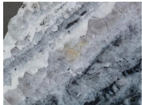
Gangstück mit klarem bis leicht violetterm Fluorapatit

2) Fluorapatit: \text{CaF}_2 wird in der chemischen Industrie verwendet, um z. B. Fluorwasserstoffsäure herzustellen. Weiterhin wird es zur Produktion von Kryolith ( \text{Na}_3\text{AlF}_6 ) genutzt; bei der Aluminiumerzeugung aus Bauxit wird synthetischer Kryolith eingesetzt, da er den Schmelzpunkt herabsetzt. In der Metallurgie dient \text{CaF}_2 als Flussmittel für die Schlacke bei der Eisenverhüttung. Weitere Verwendungsbereiche liegen in der Keramik- und Glasindustrie, Schweißtechnik sowie als Pflanzenschutzmittel und Zahnpasta.