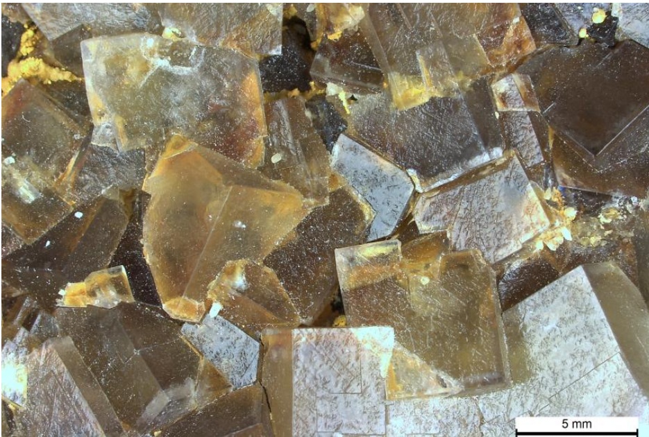
Flussspatkristalle aus der Grube Clara

Die Ganggesteine bestehen aus einer Verwachsung der beiden genannten Spate und enthalten stets Quarz, Karbonate und Erzminerale sowie Nebengesteinseinschlüsse. Die Kristalle des Baryts sind meist tafelig ausgebildet und im Schwarzwald fast immer reinweiß, selten leicht rötlich. Eine Sonderform sind keilförmige Kristalle, der sog. Meißelspat , der hauptsächlich im Kinzigtal auftritt. Fluorit ist meist wasserklar bis violett, selten grünlich oder gelblich; können die Fluoritkristalle frei wachsen (in Hohlräumen bzw. „Drusen“), so bilden sie fast immer würfelförmige Kristalle .