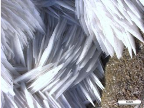
Weißer Schwefelspatkristalle aus der Grube Clara