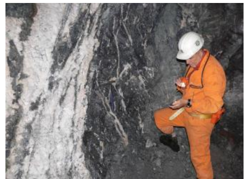
Fahlerzreicher Schwefelspatgang in der Grube Clara

Die geologische Mächtigkeit der Schwefelspatgänge im Schwarzwald variiert von wenigen cm bis über 10 m ; bauwürdige Mächtigkeiten von Barytgängen erreichen in der der Grube Clara durchschnittlich 3–4 m , in steilen Abschnitten kann die Mächtigkeit auch bis auf 12 m ansteigen. Die geologische Mächtigkeit der Flussspatgänge schwankt ebenfalls stark. Die genutzte Mächtigkeit ist abhängig vom Fluoritgehalt im Gang; dieser sollte aus abbautechnischen Gründen mehr als 2 m betragen. Die bekannten Flussspatgänge im Schwarzwald sind zwischen 1 und 4 m mächtig, in Ausnahmefällen auch bis 30 m .