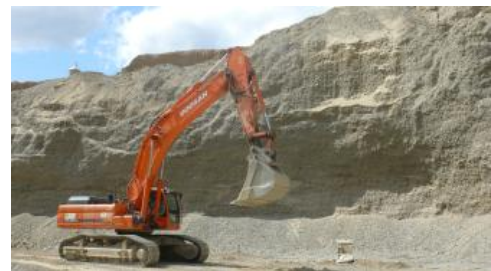
Sandige Kiese der Dietmanns-Formation

Genutzte Mächtigkeit: Im Raum Krauchenwies–Pfullendorf werden die sandigen Kiese in einer Mächtigkeit von etwa 10–30 m im Trockenabbau gewonnen.