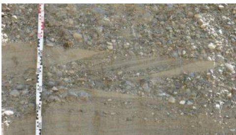
Schrägschichtung von Kiesen und Sanden

Die Kiesvorkommen befinden sich in einem Gebiet, welches durch mehrere Gletschervorstöße mit anschließendem Eiszerfall, Sedimentation und Erosion gekennzeichnet ist. Ablagerungen aus Bereichen vor, unter, im und auf dem Gletscher verzahnen sich eng miteinander und wurden teilweise mehrfach umgelagert. Dies äußert sich in einer stark schwankenden Höhenlage der Quartär- bzw. Kiesbasis, einem stark heterogenen Aufbau der betrachteten Gebiete mit stark variierenden Kies- und Abraummächtigkeiten (einschließlich nicht verwertbarer Zwischenschichten), unterschiedlich hohen Feinkornanteilen sowie in stark schwankenden Nagelfluh- und Sandanteilen. Aus diesen unterschiedlichen