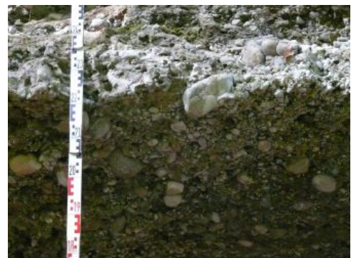
Zu Nagelluh verfestigte Tiefere Hochrhein-Deckenschotter

Vorherrschend sind lagig geschichtete, fein- bis mittelkiesige, zum Teil steinige, mittel- bis grobsandige Grobkiese . Eingeschaltet sind stark steinige Groblagen mit einem Anteil von geschätzt 40–50 % Sand . Der Sandanteil in den sandigen Kiesen beträgt ca. 20–40 %, der Steingehalt liegt bei 10–20 % (Schätzwerte). Der Schluff-Tonanteil ist mit < 3 % sehr gering. Die Kiese sind schlecht sortiert . Abgesehen von der Basislage mit 1 m 3 -großen Blöcken sind die Steine meist faust- bis kopfgroß, selten auch bis 50 cm groß. Die Sedimente stammen weitgehend aus unterschiedlichen alpinen Herkunftsgebieten südlich des Bodensees. Dazu kommen lokale Komponenten aus der Molasse . Die Hochrhein-Deckenschotter wurden in einem überwiegend nach Westen gerichteten Entwässerungssystem in unterschiedlichen Rinnen abgelagert.