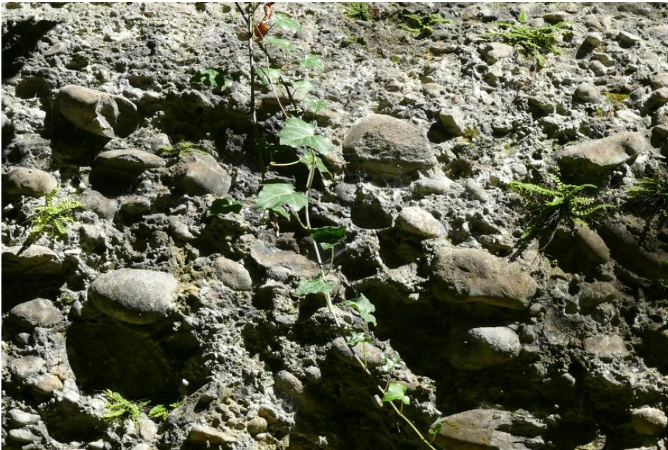
Grobkieslage mit Steinen bis Faustgröße

Genutzte Mächtigkeit: Am Heilsberg bei Gottmadingen und am Rauhenberg bei Gailingen am Hochrhein sowie am Schiener Berg wurden die Tieferen Deckenschotter an mehreren Stellen in einer Mächtigkeit zwischen 10 und 30 m im Trockenabbau gewonnen.