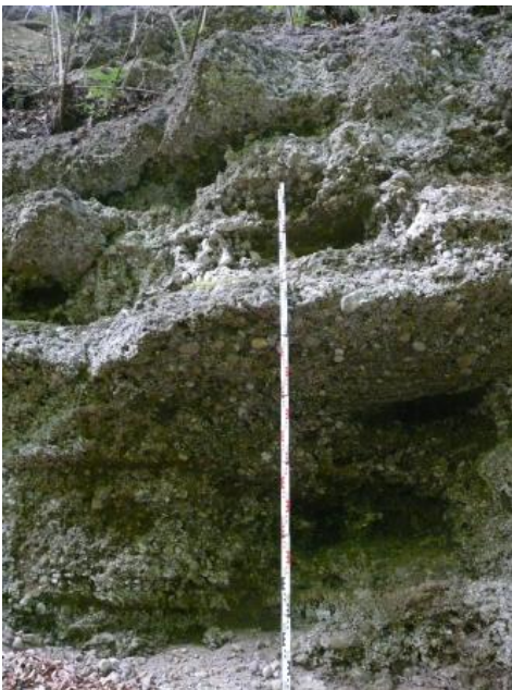
Hochrhein-Deckenschotter in einer ehemaligen Kiesgrube bei Öhningen-Bannholz