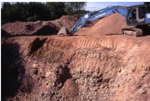
Granitgrube bei Heiligkreuzsteinach

Der anstehende Granit setzt sich wie folgt zusammen: Biotit , 2–3 mm groß, schwarz (Anteil ca. 5 %), Quarz , hellgrau, in Zwickeln (Anteil ca. 20 %), Feldspäte (Anteil ca. 70 %, Kalifeldspat > Plagioklas), 2–5 mm große, weißbeige Plagioklase, fleischrote Kalifeldspäte, zum Teil auch 20 mm lang, einzeln in der Grundmasse, Feldspäte oft vollständig umgewandelt, der Grad der Umwandlung nimmt dabei von unten nach oben zu, im Grus finden sich stark umgewandelte Biotite.