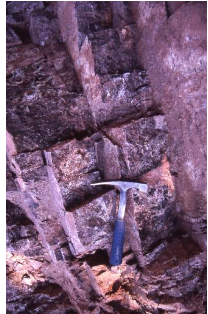
Engständig geklüfteter Heidelberg-Granit