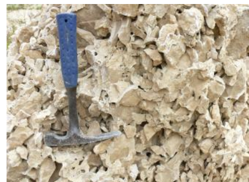
Durch Kalkvermittlung verfestigter, druckfester, brekzienartiger „Albschutt“

Der sogenannte Albschutt, Hangschutt aus der Wohlgeschichtete-Kalke-Formation, bedeckt schleierförmig und hangparallel zahlreiche untere Talhänge, zumeist im Niveau der Impressamergel-Formation. Der Hangschutt wurde im eiszeitlichen Klima angeliefert und ist als periglaziale Bildung anzusprechen (Schreiner, 1992b).