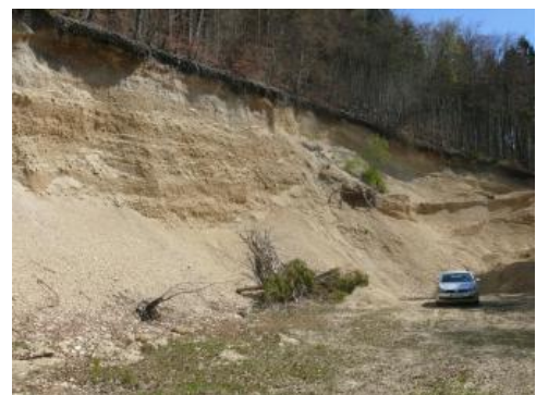
Abbauwand aus Weißjura-Hangschutt

Verwendung: Der „Albschutt“ besitzt bei gleichmäßiger Körnung eine ideale Zusammensetzung für den Forstwegebau (Mineralbetongemische). Als Vorteile des Albschutts werden die bessere Verdichtung beim Einbau, der deutlich kürzere Transportweg sowie das rasche Abtrocknen nach Regenfällen genannt.