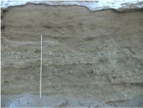
Lagen aus Albschutt mit unterschiedlichen Korngrößen

Der Albschutt setzt sich aus zahlreichen, überwiegend kleinstückigen, eckig-kantigen, cm-großen Kalksteinkomponenten mit einer feinkörnigen Matrix aus schluffigem Ton (stark karbonatisch = Mergel) zusammen. Lagenweise kommen plattig-scherbige Kalksteine von 10–20 cm Länge vor. Weiterhin ist eine deutliche, horizontale Schichtung erkennbar, die einzelnen Lagen sind dm bis 1 m mächtig, wobei die Lagen unterschiedliche Korngrößen aufweisen. Laut vorliegenden Korngrößenanalysen handelte es sich bei dem „Albschutt“ um einen tonig-schluffigen, steinigen, schwach sandigen Fein- bis Grobkies („Kalksteinkies“) mit einer gleichmäßigen Kornverteilung. Die einzelnen Kalksteinkomponenten zeigen dabei wenig mechanische Abnutzung und nur geringe Spuren von Verwitterung (Spitz, 1930b).