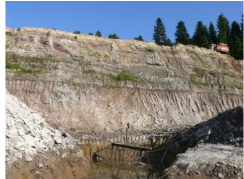
Abbauwand in der Sandgrube Gschwend

Gewinnung: Die Gewinnung der Sande sowie untergeordnet von schwach verwitterten Sandsteinen erfolgt im Trockenabbau mittels Bagger bzw. Radlader. Die Aufbereitung des Materials findet z. T. vor Ort mit einer stationären oder mobilen Brech- und Siebanlage statt. Falls der Stubensandstein stark verfestigt ist, wird dieser zuerst durch Lockerungssprengung gelöst. In kleinen Sandgruben wird das gewonnene Material für einige Zeit aufgehaldet und der Witterung ausgesetzt, wodurch noch vorhandene Kornbindungen aufgelockert werden. Mächtigere Ton- und Mergelsteinlagen müssen beim Abbau selektiv ausgehalten werden.