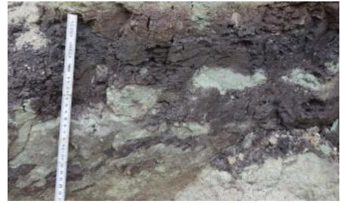
Sandstein mit tonig-mergeligen Zwischenlagen

Die meist mittel- bis dickbankigen, häufig horizontal- und schräggeschichteten Sandsteine sind vorwiegend grob- bis mittelkörnig, untergeordnet kommen feinsandige und fein- bis mittelkiesige Partien vor. Die hellgrauen Quarzkörner sind 1–3 mm groß und kaum kantengerundet. Die weißen, z. T. auch fleischroten 1–4 mm großen Feldspäte sind verwittert. Weiterhin kommt Hellglimmer vor. Unverwitterte Sandsteine weisen ein kieseliges, karbonatisches (inkl. dolomitisches) oder toniges Bindemittel auf. Durch die Verwitterung der Gesteine wird insbesondere das karbonatische Bindemittel zwischen den Mineralkomponenten gelöst und es bilden sich Mürbsandsteine. Diese sanden oft stark ab und sind nahe der Oberfläche häufig vollständig zu Sand verwittert. Ein besonderes Merkmal der Abfolge ist, dass die Verfestigung sehr kleinräumig wechselt. Unregelmäßig sind cm- bis dm-mächtige rote und grüne Ton- und Schluffsteine eingeschaltet.