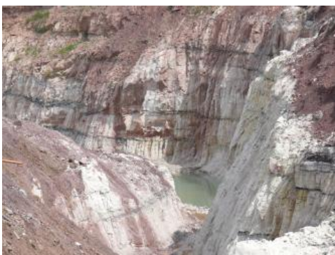
Sandsteine im Steinbruch Berglen-Höblinswart

Die Sedimente der Löwenstein-Formation (Stubensandstein-Schichten) bilden einen schichtförmig aufgebauten Gesteinskörper, der sich westlich und nördlich der Schwäbischen Alb erstreckt und große Teile des Keuperberglandes einnimmt. Er fällt mit wenigen Grad nach Süden bis Südosten ein und besteht aus einer Wechselfolge von Sandsteinen und Tonsteinen. Die Gesteine bildeten sich in einem weit verzweigten Flusssystem , in dem die Sandsteine die Rinnenfüllungen und die Tonsteine die Ablagerungen der Überflutungsebene repräsentieren. Die stetige Verlagerung der Flussrinnen bedingte sowohl horizontal als auch vertikal einen raschen Wechsel von Sand- und Tonsteinen . Die verwitterten Partien werden als Mürbsandsteine bezeichnet.