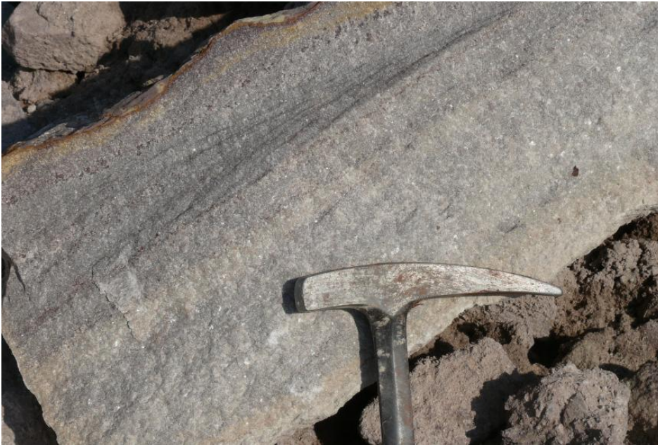
Sandstein „Fleins“ aus Gschwend.