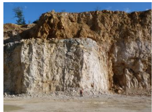
Stark verkarsteter Massenkalk

Verwendung: Die Kalksteine werden hauptsächlich als Schotter, Splitte, Schroppen, Frostschutz- und Schottertragschichten, kornabgestufte Gemische, Brechsande und Schüttmaterialien für den Verkehrswegebau , für Baustoffe sowie als Betonzuschlag verwendet. Dolomitsteine können zur Düngemittelproduktion genutzt werden.