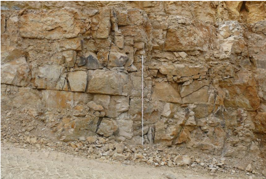
Deutlich geschichteter, mikritischer Kalkstein