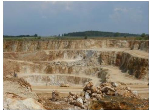
Der Kalksteinabbau im Steinbruch Giengen an der Brenz wird über fünf Sohlen betrieben.