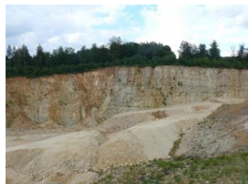
Westwand des Steinbruchs

Die zur Herstellung von Natursteinkörnungen nutzbaren Massen- und Bankkalksteine des Oberjuras der Ostalb bilden einen flächenhaften, schichtig aufgebauten Rohstoffkörper, der mit wenigen Grad nach Süden bis Südosten einfällt. Die Formen und Ausdehnungen der Lagerstättenkörper sind von verschiedenen Kriterien abhängig, wie z. B. die sekundäre Umwandlung der Kalksteine zu (bedingt nutzbarem) Dolomitstein und (nicht verwertbaren) dedolomitierten Karbonatgesteinen. Das dedolomitierte bzw. recalcitisierte Gestein , auch als „Zucker KornloCHFels“ bezeichnet, tritt in weiten Teilen der Schwäbischen Alb auf. Damit gehen Verkarstung und Verlehmung einher, was sich besonders auf die Qualität der Massenkalksteine auswirkt. In den Bankkalksteinen ist die Verkarstung meist geringer, da sie tonige bis mergelige Einschaltungen zwischen den Kalkbänken aufweisen, die das Vordringen der karbonatlösenden Niederschlagswässer und damit die Verkarstung einschränken bzw. verhindern. Eine weitere Barriere für die Verkarstung stellt die sog. Glaukonitbank dar; dabei handelt es sich um zwei grünlichbeige Kalkmergelsteinbänke in der Untere-Felsenkalke-Formation. Der Abgrenzung der wirtschaftlich interessanten Lagerstättenkörper auf der KMR50 liegen die nutzbare Mindestmächtigkeit und ein erforderlicher Mindestvorrat von 10 Mio. t zugrunde, weiterhin sind Eintalungen, tektonische Störungszonen sowie Abraumverhältnisse zu berücksichtigen.