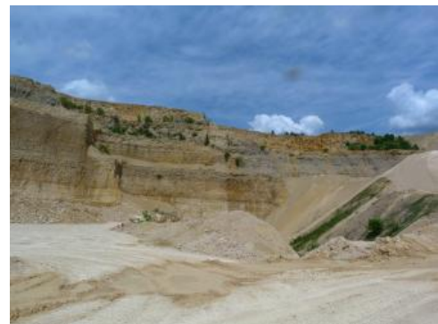
Auskeilende, dunkelgraue Lacunosamergel (joL)

Die Mächtigkeit der Wohlgeschichtete-Kalke-Formation reicht von 60–110 m und nimmt von Süden nach Norden ab. Durch eine häufig auftretende Verschwammung (Lochenfazies) kommt es im Bereich Wehingen–Ober-/Unterdigisheim–Meßstetten und Ratshausen–Hausen am Tann–Tieringen sowie bei Margrethausen–Burgfelden zu erheblichen Mächtigkeitsreduzierungen innerhalb der Schichtfazies. Durch das Auftreten der Mittleren Lochen-Schichten ist dort die Mächtigkeit der Wohlgeschichtete-Kalke-Formation auf 10–60 m reduziert.