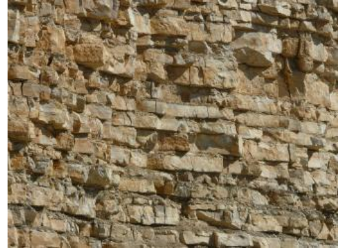
Detailaufnahme aus dem aufgelassenen Steinbruch Seitingen-Oberflacht

Chemische Zusammensetzung für die Bankkalksteine der Wohlgeschichtete-Kalke-Formation (7 Proben aus den Steinbrüchen Geisingen (RG 8018-1), Dürbheim (RG 7918-1), Deilingen (Riese, RG 7818-2), Dotternhausen (Plettenberg, RG 7718-1), dem aufgelassenen Steinbruch Albstadt-Pfeffingen (Auchtberg, RG 7719-1) und der LGRB-Rohstofferkundungsbohrung Ro7819/B3 [93,2–96,6 m]: