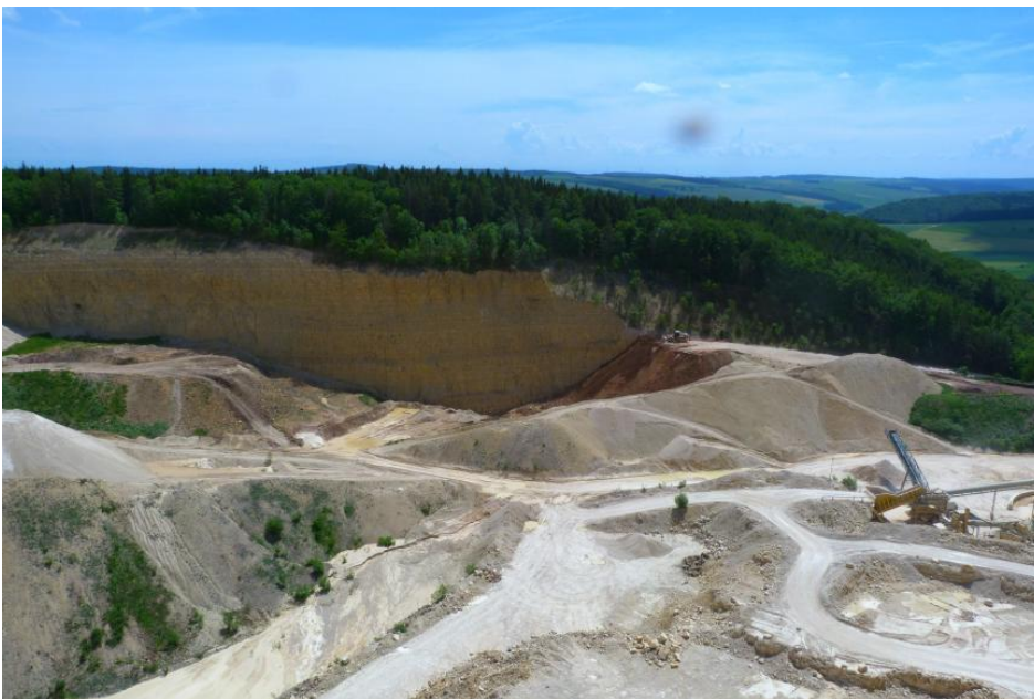
Übersicht Steinbruch Geisingen