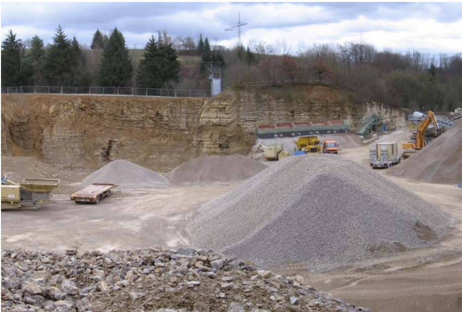
Übersicht über den Steinbruch Rheinfelden-Karsau mit Blick nach Osten