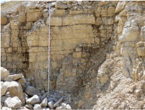
Gebankte Kalksteine des Plattenkalks im Oberen Muschelkalk

Gewinnung: Die Gesteine des Oberen Muschelkalks werden im Dinkelberg-Gebiet derzeit nur im Steinbruch bei Karsau (RG 8412-3) gewonnen. Die Gewinnung findet hier im Trockenabbau mittels Großbohrlochsprengung statt. Das so erzeugte Rohmaterial wird vor Ort durch Brechen, Sieben und Mischen aufbereitet.