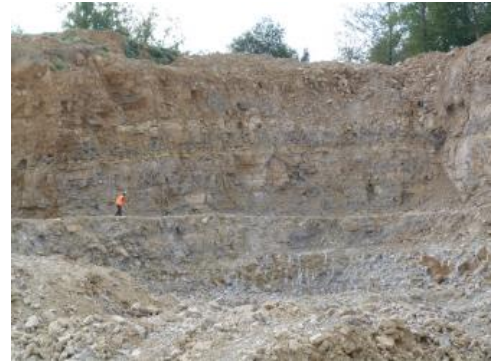
Abbaufront im Westen des Steinbruchs Rheinfelden-Karsau

Genutzte Mächtigkeit: Grundsätzlich sind die Schichten der Trochitenkalk-Formation und des Plattenkalks als Rohstoff nutzbar, woraus sich bei vollständig erhaltenen Schichten eine nutzbare Mächtigkeit von 60 m ergibt. Der einzige Steinbruch des Dinkelberg-Gebiets, der die Gesteine des Oberen Muschelkalks gewinnt, nutzt jedoch nur 40 m Mächtigkeit, da sich die übrigen 20 m des Trochitenkalks unterhalb der Talsohle befinden und somit unterhalb des Grundwasserspiegels abgebaut werden müssten. Die Gesteine des Trigonodusdolomits können aufgrund ihrer mechanischen Eigenschaften nicht verwertet werden (Abraum).