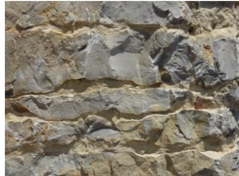
Detail aus dem Plattenkalk

Die Trochitenkalk-Formation (moTK) besteht aus grauen, sparitischen Kalksteinen, die Ooide, Schill und Trochiten enthalten (teilweise gesteinsbildend), sowie aus bläulich grauen mikritischen Kalksteinen. Die einzelnen Bänke haben meist Mächtigkeiten von 15–30 cm und werden durch Mergelfugen voneinander getrennt. Der überlagernde Plattenkalk (moP) wird von grauen, mikritischen Kalksteinen gebildet, die in Bänken von bis 20 cm Mächtigkeit vorkommen. Nur einzelne Bänke sind schillführend und/oder enthalten Ooide. Die Bänke werden durch dünne Mergelfugen voneinander getrennt.