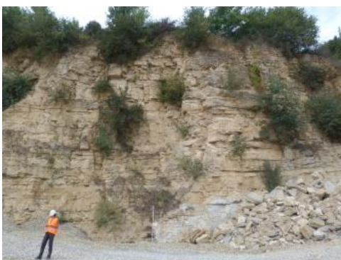
Abbauwand der aufgeschlossenen Plattenkalk-Formation im Oberen Muschelkalk bei Rheinfelden-Karsau

Die nutzbaren Kalksteine des Oberen Muschelkalks im Dinkelberg-Gebiet bilden flächenhafte, schichtig aufgebaute Rohstoffkörper. Der Obere Muschelkalk ist in drei Abschnitte gegliedert (von unten nach oben): Trochitenkalk-Formation (moTK), Plattenkalk (moP) und Trigonodusdolomit (moD). Die Kalksteinvorkommen im Oberen Muschelkalk werden durch zahlreiche, meist N-S verlaufende Graben- und Horst-Strukturen in tektonische Blöcke untergliedert. Die Gesteinskörper weisen entweder söhlige (= horizontale) Schichtlagerung auf oder fallen mit wenigen Grad nach NW oder SO ein. Stärkere Schichtverkipungen stehen meist mit Subrosionsvorgängen im Sulfatgestein des unterlagernden Mittleren Muschelkalks im Zusammenhang. Die Gesteine des Oberen Muschelkalks weisen besonders im Gebiet des Dinkelbergs, wie z. B. östlich der Ortschaft Nordschwaben, so starke Verkarstung und Verlehmung auf, dass sie aus rohstoffgeologischer Sicht als nicht